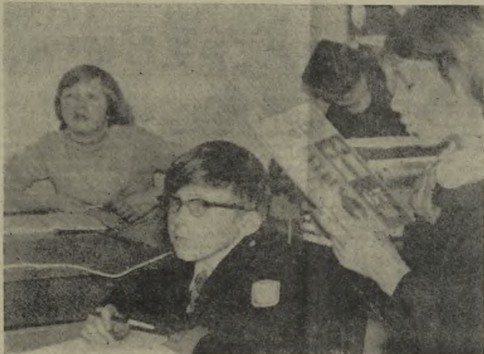
НА УРОКЕ ФИЗИКИ В ШКОЛЕ № 5