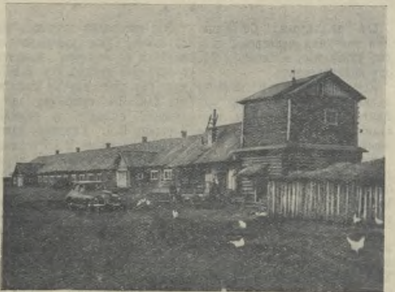
Работники животноводства колхоза имени Чапаева деятельно готовятся к стойловому содержанию скота. На снимке: одно из зданий животноводческого корпуса, готовое к приёму скота на зиму.

Потребовать от работников торгового отдела навести порядок в работе с заявками. Для этой цели немедленно претворить в жизнь ранее высказанное правлением райпо предложение по заведению лицевого счетов на каждое торгующее предприятие.