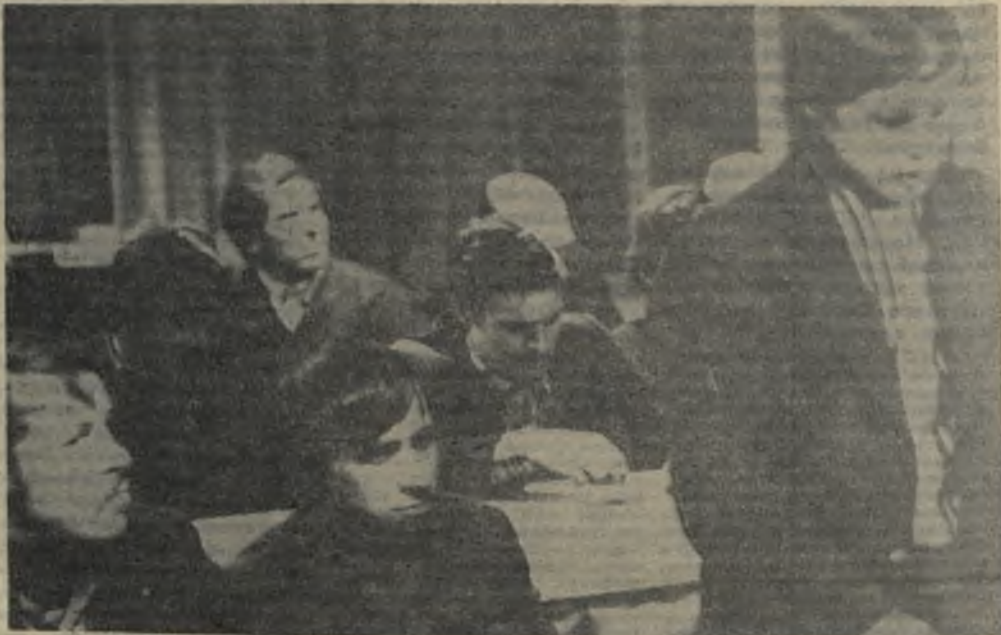
На снимке К. САВЕНИ: идет занятие в школе «Социализм и труд».

Трудно представить всех слушателей. Но даже короткая характеристика некоторых из них говорит о том, что труд пропагандиста не проходит впустую. Он приносит довольно ощутимую пользу не только слушателям, но и производству, заводу. Н. НИКИТИН,