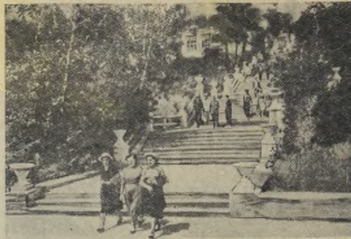
Казахская ССР. В Кокчетавской области расположен курорт Боровое. Здесь ежегодно отдыхает и лечится более 3000 трудящихся, приезжающих из разных районов страны.