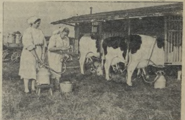
Эстонская ССР. Работники Тяхтвереской опытной базы Эстонского научно-исследовательского института животноводства и ветеринарии смонтировали передвижной доильный агрегат, в котором можно доить сразу 6 коров.

На октябрь месяц установлено задание по сдаче скота государству в незначительных размерах, и сдача переносится на более поздние сроки—ноябрь-декабрь. В целях избежания передержки скота в колхозах и производства из лишнего расходов, необходимо отобрать более упитанный скот и сдать в первой половине сентября.