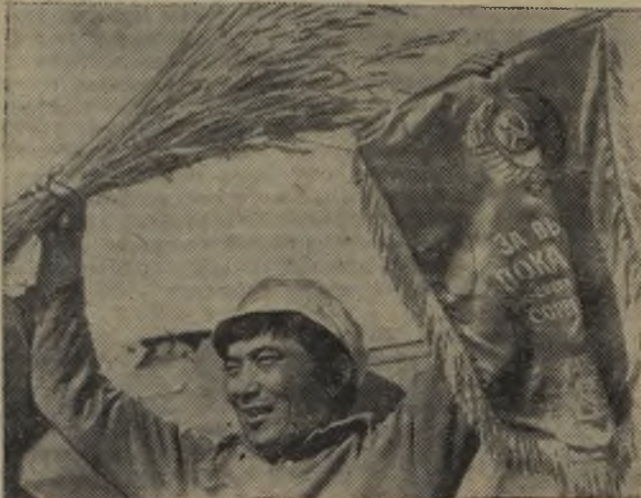
1978 г. Есть миллиард пудов казахстанского хлеба!