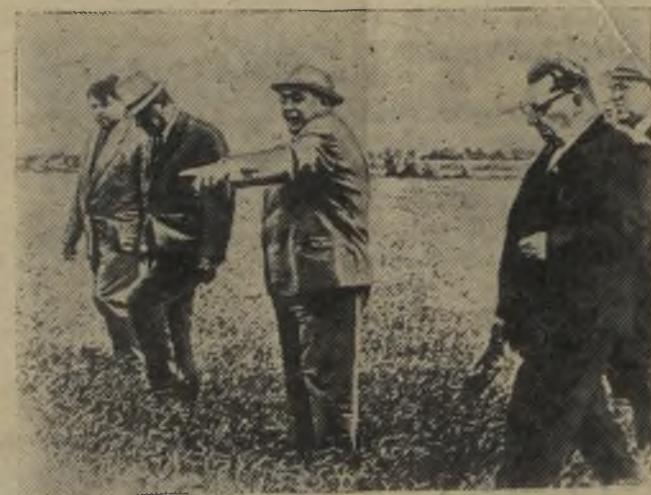
Л. И. Брежнев в целинном совхозе.