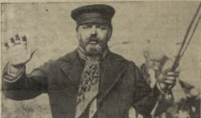
Русская и советская литература постоянно питают советский кинематограф. Зритель находит в таких фильмах мысли и чувства, отвечающие современности.

Есть славное имя у пашен, У тонких берез, у реки, У гор, городов, сел и... даже Былинок, в которых жуки. В том имени многое взято От дальних и ближних времен... Что дорого, вечно и свято, Мы Родиной нашей зовем!