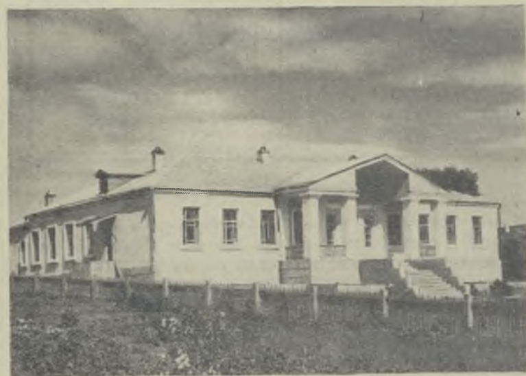
На снимке: семилетняя школа, построенная в селе Арамашка.

12. Обязать Министерство совхозов СССР, Министерство сельского хозяйства СССР, другие министерства и ведомства, имеющие совхозы и подсобные хозяйства, Советы Министров союзных республик, крайисполкомы и облисполкомы принять меры к обеспечению скота, закупленного у жителей городов, кормами и помещениями».