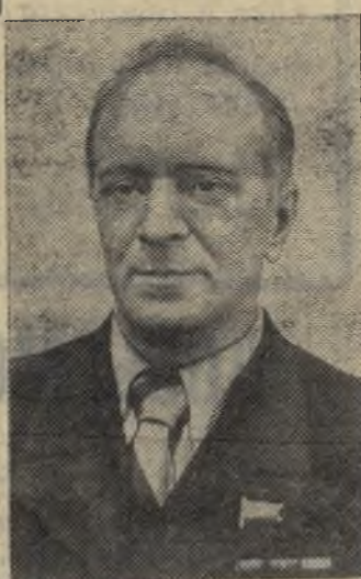
В. И. ЛЕБЕДЕВ-КУМАЧ

5 августа исполняется 80 лет со дня рождения одного из создателей советской массовой песни, поэта Василия Ивановича Лебедева-Кумача (1898—1949). Ему, как и многим другим талантам, дорогу в жизнь открыла Великая Октябрьская социалистическая революция.