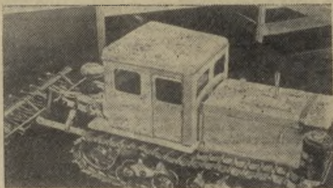
МОЛОДЫЕ НОВАТОРЫ — ЮБИЛЕЮ КОМСОМОЛА

Москва. На ВДНХ СССР в разделе Центральной выставки научно-технического творчества молодежи НТТМ-78, посвященном сельскому хозяйству, де-