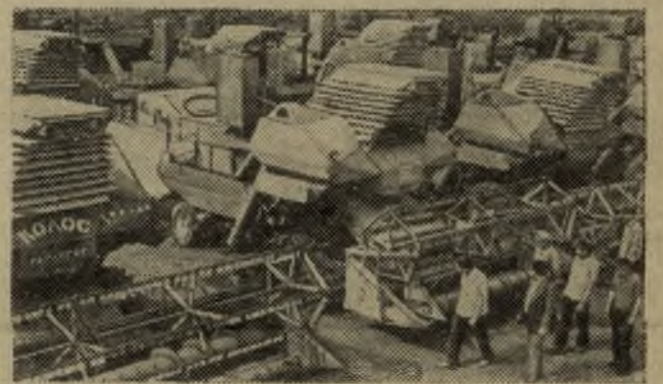
Краснодарский край. Заколосилось кубанское хлебное поле. С каждым днем близится жатва — главный экзамен для земледельцев.

Колхоз «Победа» Брюховецкого района славится на Кубани богатыми урожаями и хлеборобскими традициями. Колхозные механизаторы подготовили всю технику к жатве. На линейке готовности стоит 70 комбайнов, 47 жаток. Зерновое поле занимает 6982 гектара, и эту площадь решено убрать в минимальный срок — за 8—9 дней.