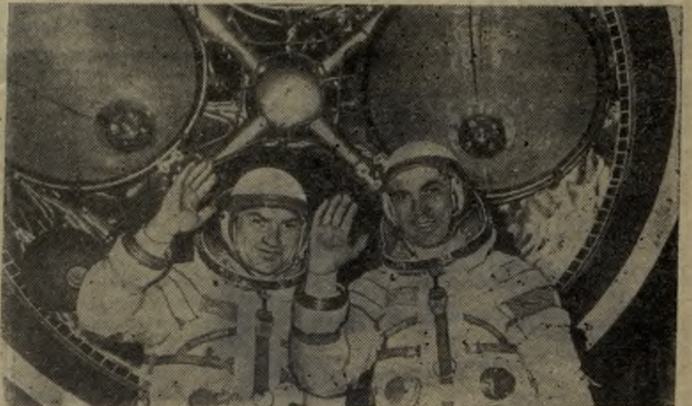
Байконур. Экипаж «Союза-29» в монтажно-испытательном корпусе. Слева направо — командир корабля летчик-космонавт СССР Владимир Коваленок и бортинженер Александр Иванченков.

Программа работ международного экипажа на околоземной орбите выполняется успешно.