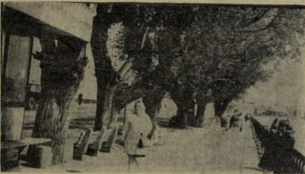
долгожители — тополя на городской плотине Режа.

Найден зонтик (в центре). Обращаться: ул. Ленина, 74/1-4.