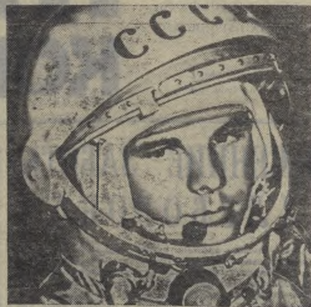
На снимке: летчик-космонавт СССР Юрий Алексеевич Гагарин перед полетом в космос. 1961 год.

секретарь Останинского сельского Совета.