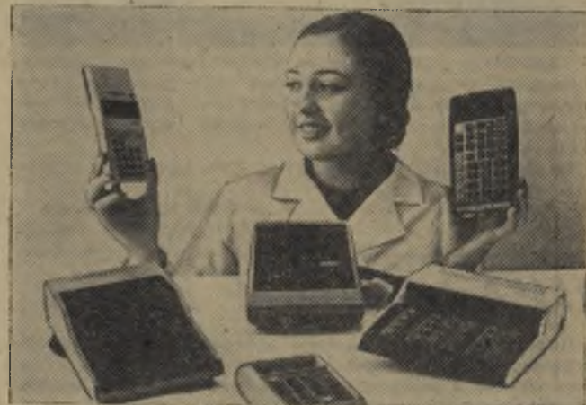
ЭФФЕКТИВНОСТЬ И КАЧЕСТВО

Всевозможные электровакуумные приборы, интегральные схемы, миниатюрные электронные вычислительные машины, товары народного потребления с маркой ленинградского производственного объединения «Светлана» пользуются постоянно растущим спросом. Количество их потребителей уже перевалило за десять тысяч. Причина такой популярности — в качестве продукции, отличающейся надежностью и стабильностью, отличными техническими характеристиками и долговечностью.