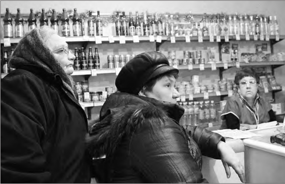
* В поселковом магазине: разговор о жите-бытье.