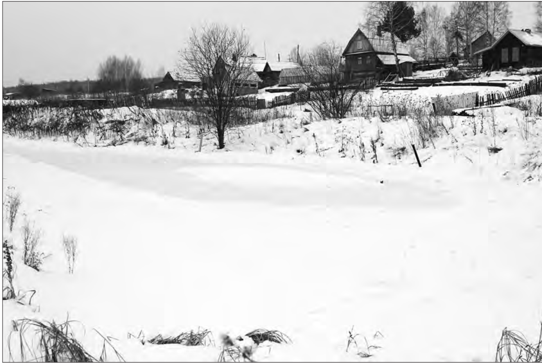
* Чащино. У старого водоема.

Площадка действительно выглядит небогато. Но ... использование подручных средств, например, веток для забора, в некотором роде даже добавляет сельского колорита. Говорят, детские праздники проходят здесь весело и интересно. Словом, не каждое лыко в строку.