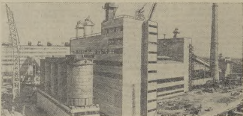
Новосибирская область. Строители и эксплуатационники Никитинского электродного завода (на снимке) подготовили хороший трудовой подарок к 60-летию Великого Октября. Вступила в строй действующих первая очередь предприятия.

Первая партия его продукции — электродной массы — уже отгружена потребителю — Норильскому горно-металлургическому комбинату.