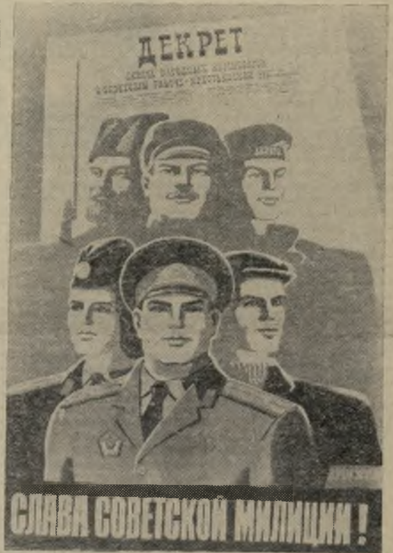
Плакат художника Г. Гаусмана. Издательство «Плакат».

Служба, дни и ночи... И если в городе спокойно—это лучшая награда за их труд. Р. ШУБИН, заместитель начальника ГОВД.