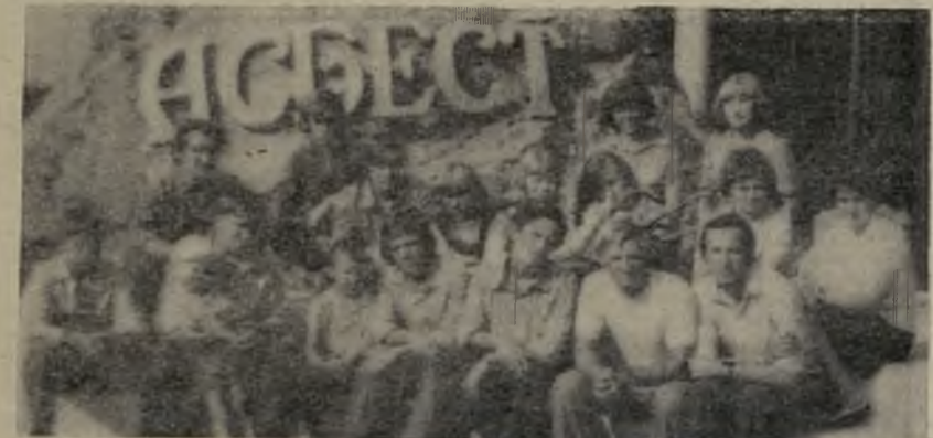
На снимке: сборная команда Режа по многоборью ГТО.