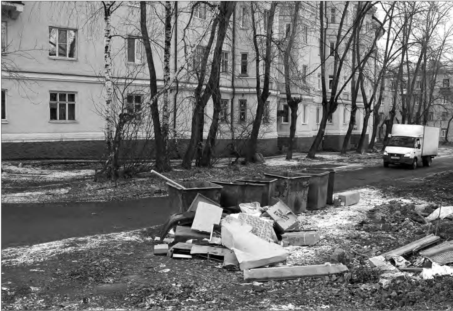
У контейнеров – всегда горы мусора.