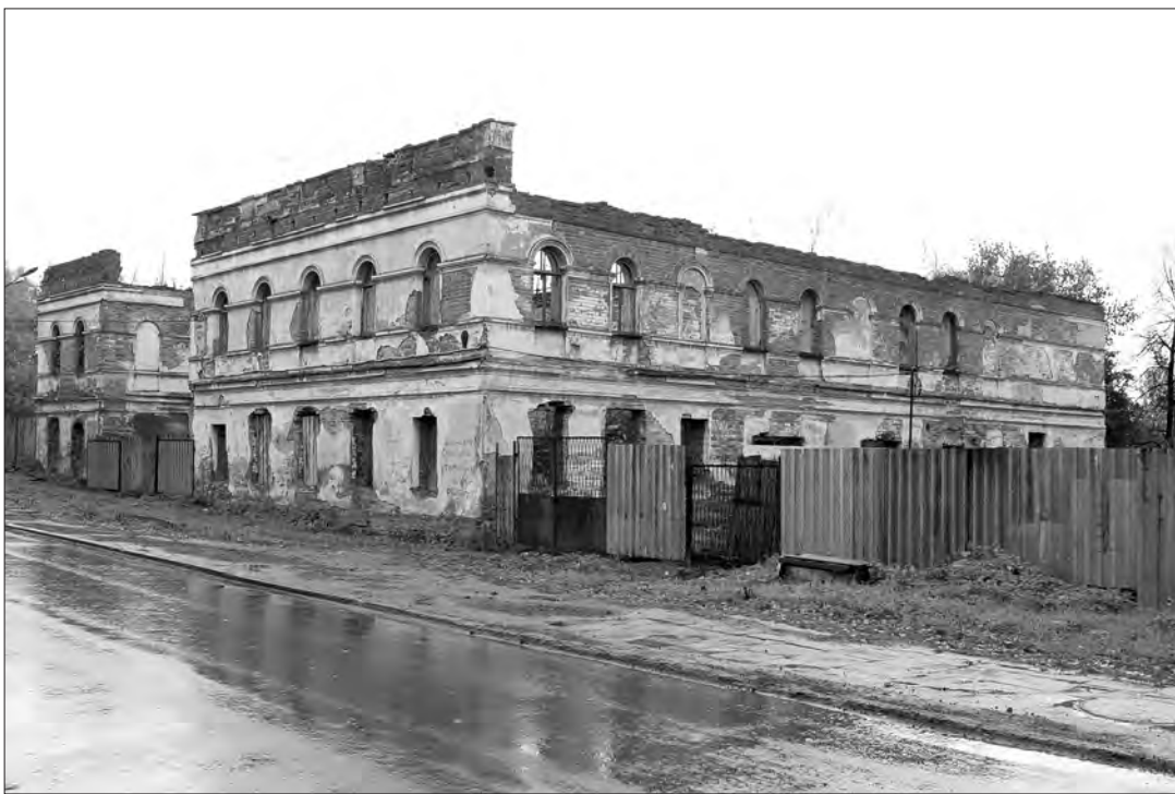
Так сегодня выглядит Земский дом (ул. Уральская, 8).

Деятельность земства носила, главным образом, культурно-просветительский характер и была чрезвычайно разнообразна: открытие школ, библиотек, устройство больниц, меры для поднятия уровня сельского хозяйства. За короткий срок с 1874 до 1913 года в Нижнем Тагиле земскими деятелями, опирающимися на общественность, было открыто свыше десятка новых школ и училищ, построена земская больница, основан ветеринарный пункт, который занимался развитием племенного дела - разведением молочного скота тагильской породы.