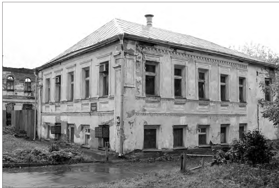
А это здание библиотеки музея-заповедника (ул. Уральская, 6).

Чтобы этого не происходило, необходимо учитывать прежние функции, которые выполняло то или иное здание. Это даст возможность не только сохранить памятник, но и принести городу реальную пользу. Прежде всего, это касается памятников культуры, к которым в полной мере можно отнести и Земский дом.