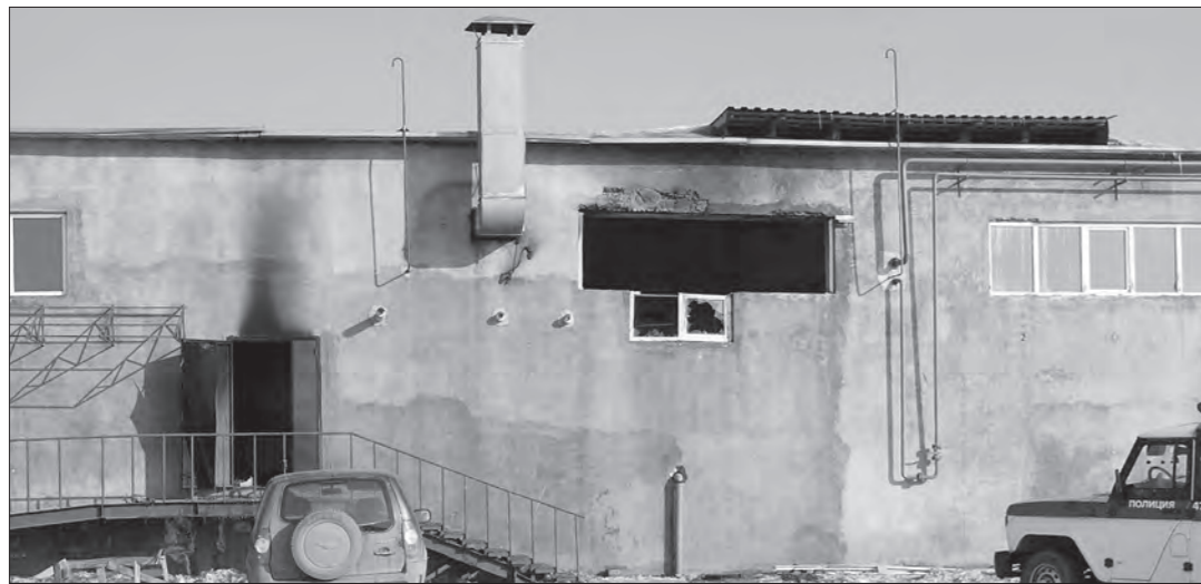
* Котельная после взрыва.