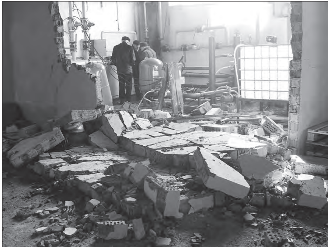
* От взрыва обрушились внутренние перегородки.

Начиненная итальянским оборудованием, котельная в помещении оптово-складской базы торговой компании «Паритет-НТ» по Восточному шоссе, 17, стала вчера объектом повышенной опасности. Около половины восьмого утра в этой котельной, расположенной за центром оптовой торговли «Восточный», прогремел взрыв. Первыми о его последствиях узнали те, кто прибыл в 7.50 на работу в складские помещения.