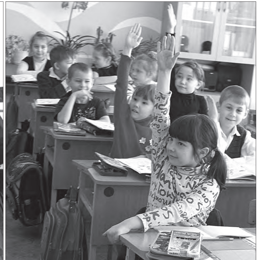
* 1-й «Б» готов к уроку.

Это строки из письма подполковника Сергея Бырылова в родную школу №1 имени Крупской. В школьном музее, пережившем четыре реконструкции, есть выставка «Рыцари неба» к 100-летию Военно-воздушных сил России. Среди материалов, полученных путем скрупулезных поисков, стенд, посвященный