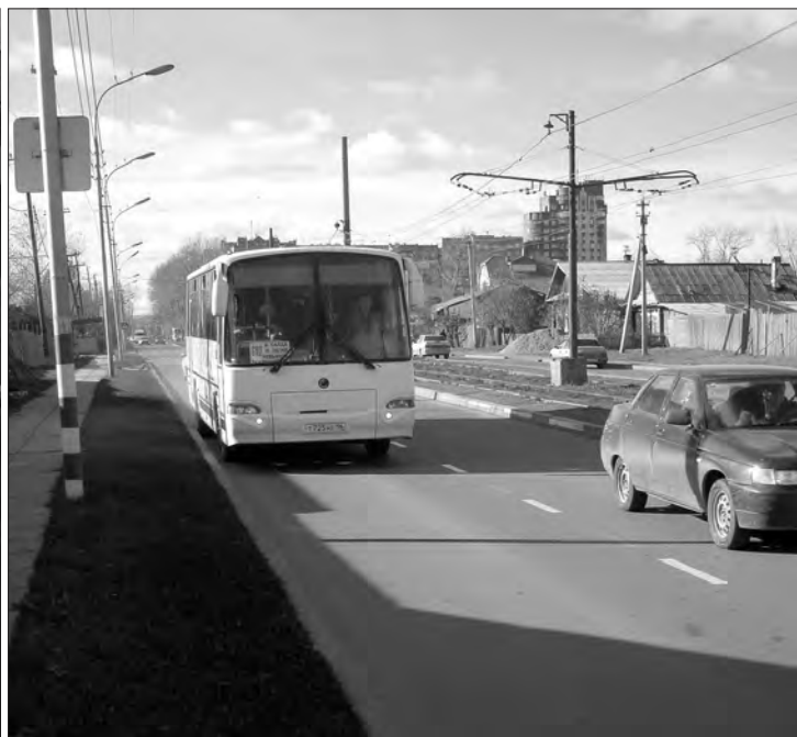
На улице Кулибина.