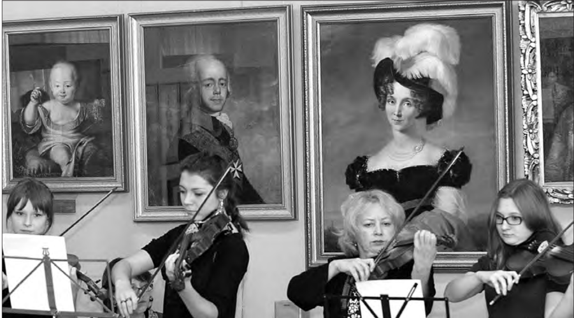
На открытии выставки «Романовы. Эпизоды истории» и музыка была соответствующая – «Боже царя храни».