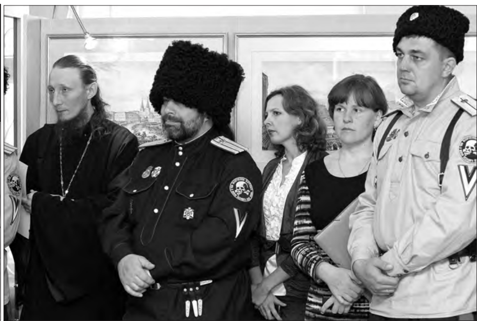
Первые посетители.