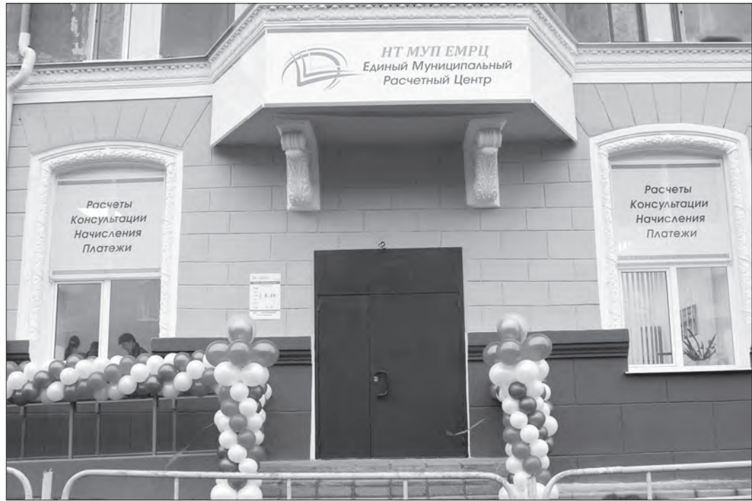
Единый муниципальный расчетный центр открыт.