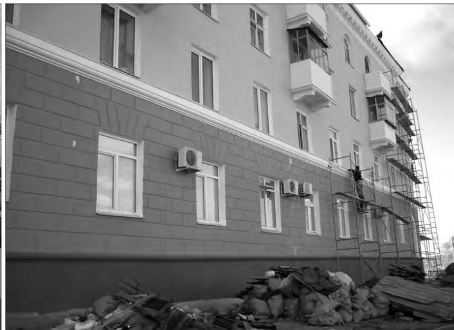
Дом на улице Вогульской радуется жителей ярким фасадом.

На минувшей неделе депутаты постоянной комиссии по городскому и жилищно-коммунальному хозяйству Нижнетагильской городской думы провели выездное заседание, посетив объекты, отремонтированные в текущем году. Народные избранники побывали на улицах Береговой-Ударной и Кулибина, посетили дома №60 по улице Вогульской, №11 – по Красной, №2 и №4 – по Энтузиастов.