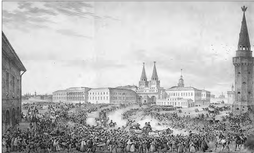
Работа из серии «Виды самых интересных церемоний коронации императора Николая I и императрицы Александры в Москве».