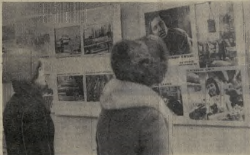
В зале фотовыставки.