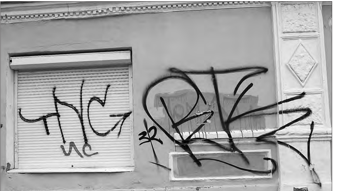
Следы «бомбежки» на этом здании по проспекту Ленина сейчас уже не видны. И хочется верить, что атака не повторится.

шают райтеров поработать на таких объектах. Если за маркеры берутся не просто бомбилы, а уличные граффити, то броские «теги» или яркие рисунки совсем не портят, а украшают городской пейзаж. И вряд ли у кого-то поднимется рука замазать их известкой.