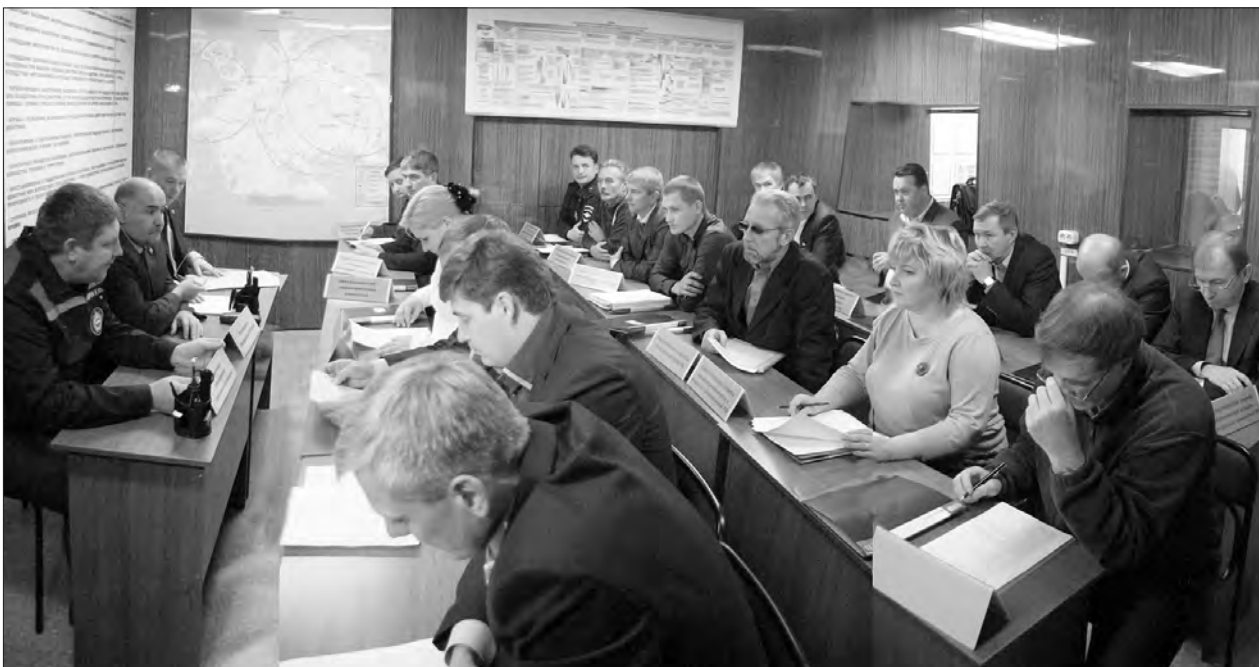
Подведение итогов учений в конференц-зале убежища.