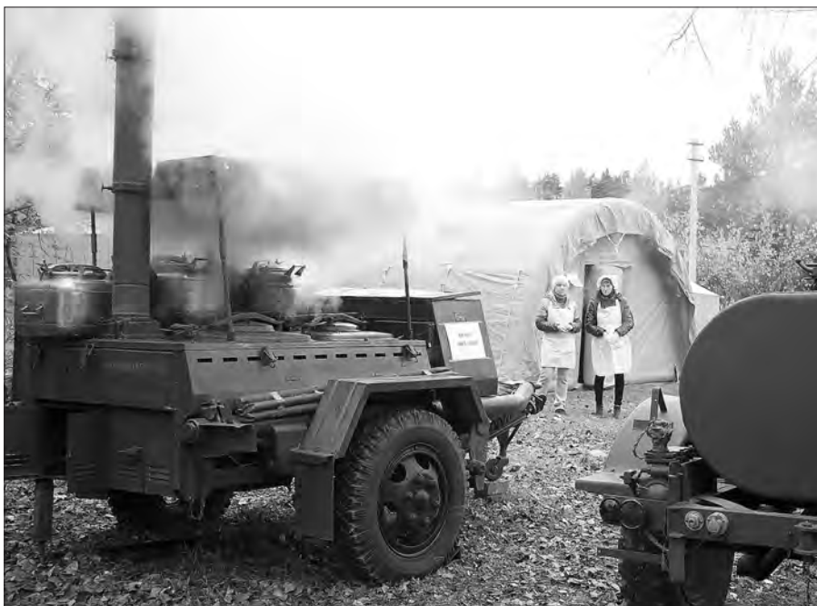
На полевой кухне готовится каша, повара собираются накрыть на стол.