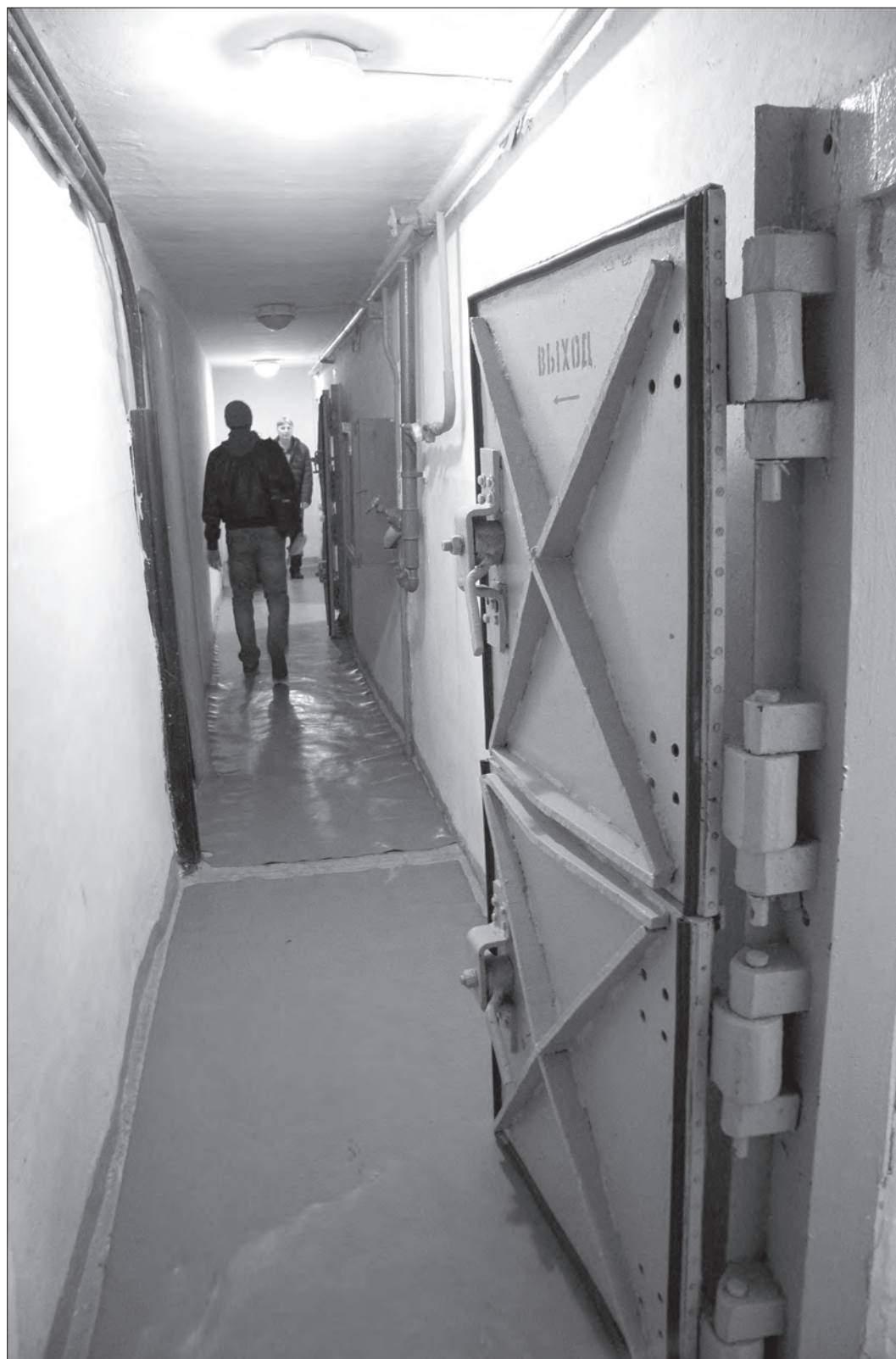
В узких коридорах подземного убежища можно легко заблудиться. ФОТО НИКОЛАЯ АНТОНОВА.

4 октября в рамках Дня гражданской обороны по всей стране, в том числе — и в Нижнем Тагиле, прошли командно-штабные учения. Журналистам показали секретный бункер и накормили гречневой кашей из полевой кухни. Однако все по порядку.