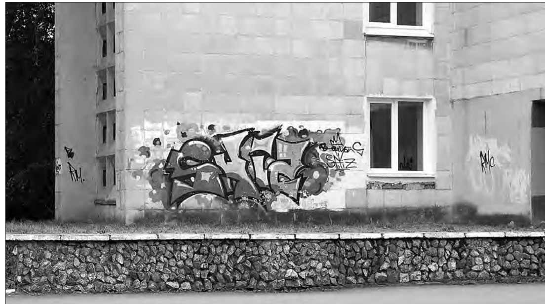
Серые стены учебного заведения украшены ярким автографом. Хотя студенты могли бы взять инициативу в свои руки и оформить алма-матер поинтереснее.

тать. Ведь немало обновленных нынешним летом домов простояли не тронутыми ни расклеиваемыми листовками, ни ребятами, что носят в карманах баллончики или маркеры. Когда наконец-то отремонтировали здания старой купеческой застройки по проспекту Ленина, мы каждый день шли мимо с трепетом: не испещрены ли стены свежими отметинами? К тому же, обращение к молодежи с просьбой этого не делать (хотя бы из уважения к сединам посетителям), висело на фасаде дома №15, где размещается центр ветеранов. И тот факт, что просьбу услышали, сначала просто радовал. А через два месяца можно сказать спасибо подросткам: удержались от соблазна поупражняться на чистой штукатурке. Хочется думать, что не случайно: не бывалые преобразования, новые проекты, внимание к городу руководства страны настраивает горожан на позитив. Группировкам райтеров и бомбил есть где разгуляться помимо гостевых маршрутов: заброшенные развалины, глухие стены за центральными фасадами, унылый штакетник и заборы строек, бойлерные, трансформаторные и прочие строения. Существует практика, когда хозяева или городские власти пригла-