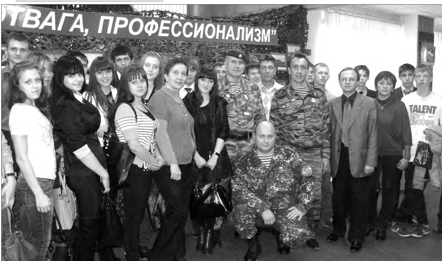
Урок в Нижнетагильском музее памяти воинов-тагильчан, погибших в локальных войнах планеты.