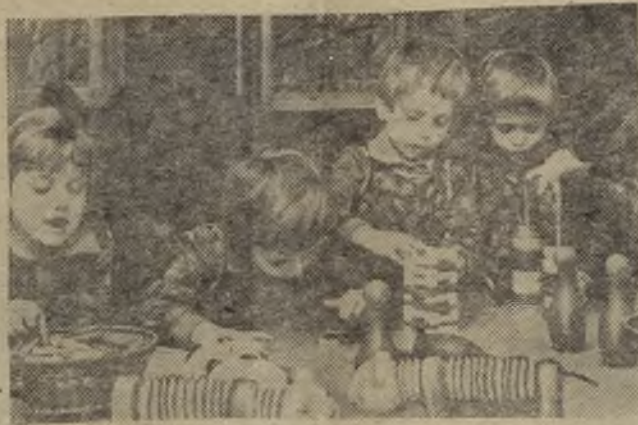
Польша. Недавно знаменитой питерке гдаьских близнецов исполнилось 4 года. Это здоровые, жизнерадостные ребята. Они с удовольствием проводят время в детском саду вместе со своими сверстниками.