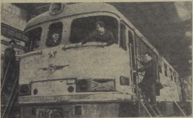
Московская область. Коллектив Коломенского теплового-строительного завода имени Куйбышева отвечает делом на призыв апрельского пленума выполнить и перевыполнить задание последнего, завершающего года пятилетки.

Началась подготовка к серийному выпуску новых тепловозов мощностью в 4000 лошадиных сил.