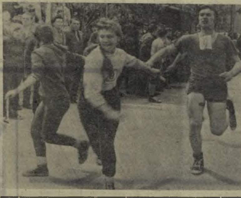
РЕДАКТОР А. П. КУРИЛЕНКО

На снимках: старт; очередной этап.