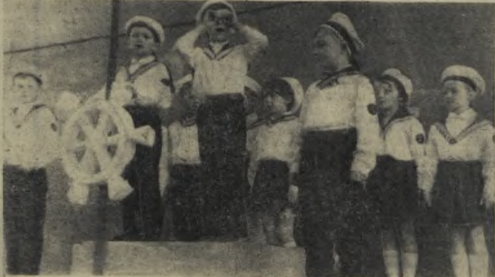
Выступают юные артисты художественной самодеятельности шк. № 3.