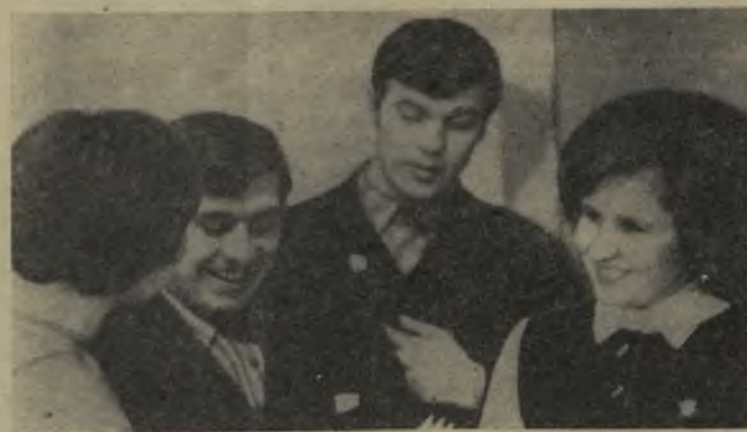
На снимках: перед началом работы пленума; в зале заседаний делегаты пленума горкома ВЛКСМ.

Пленум городского комитета комсомола выразил твердую уверенность в том, что юноши и девушки нашего города мобилизуют все свои силы на выполнение задач коммунистического строительства.