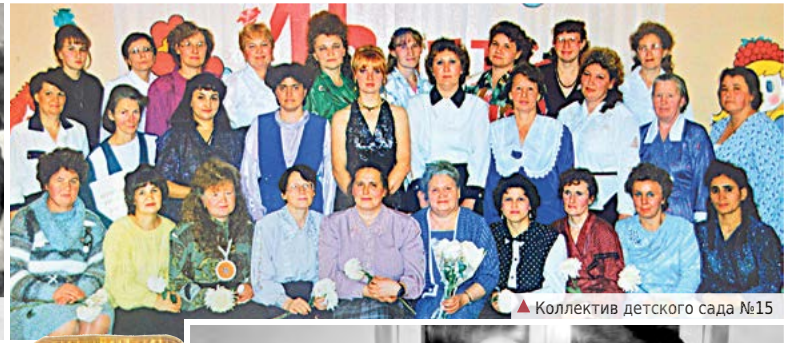
▲ Коллектив детского сада №15