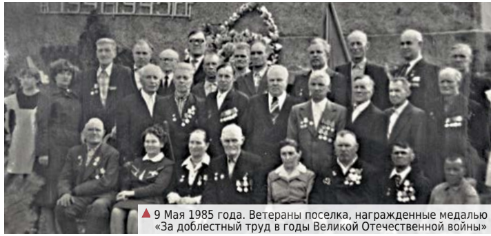
▲ 9 Мая 1985 года. Ветераны поселка, награжденные медалью «За доблестный труд в годы Великой Отечественной войны»