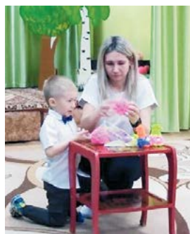
▲ Семья Ряпосовых

ся уважение и любовь к семейным традициям, а также забота о близких.