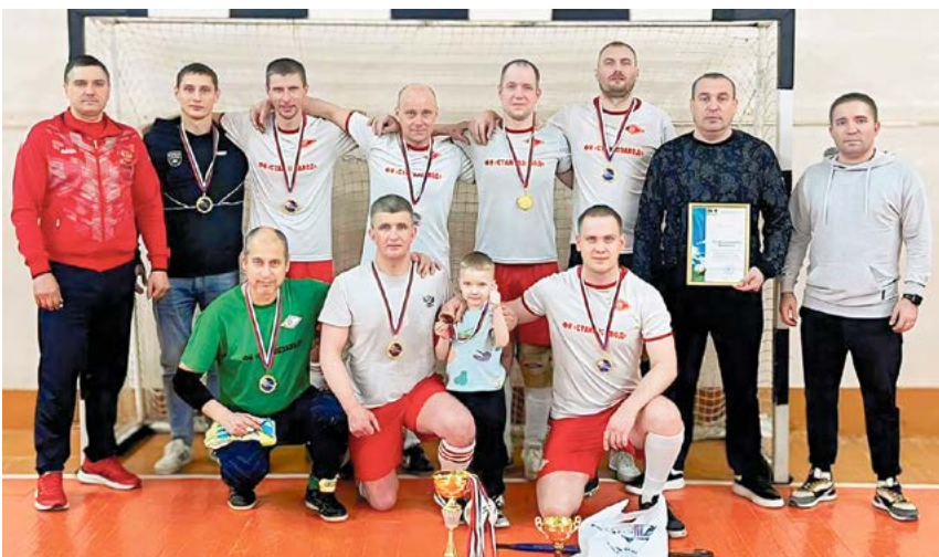
▲ Победитель серебряной лиги команда «Станкозавод»

Ян ВЕШНЯКОВ, председатель федерации футбола МО г. Алапаевск