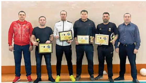
▲ Судейский корпус