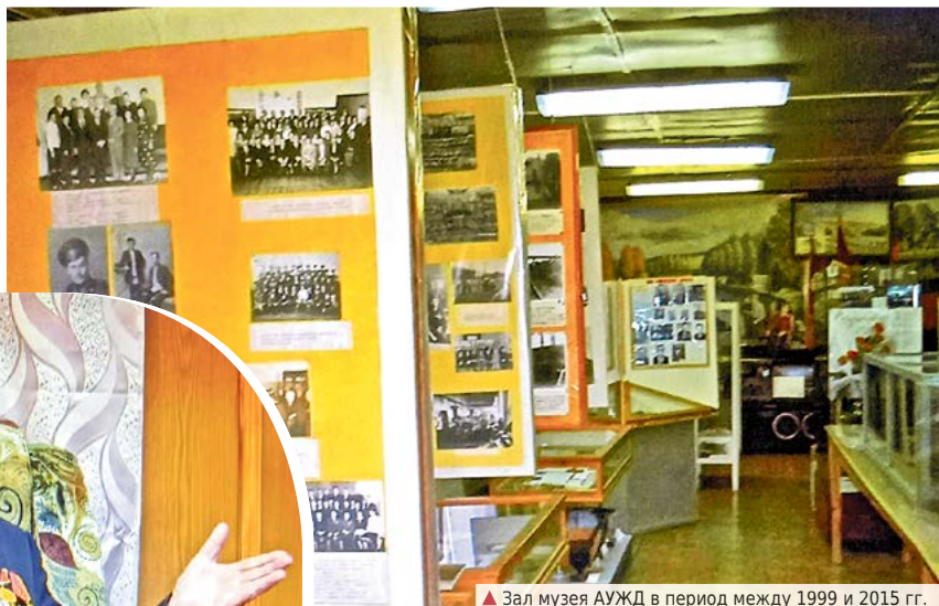
▲ Зал музея АУЖД в период между 1999 и 2015 гг.