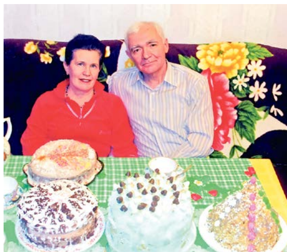
▲ Вот они, любимые торты!

имел высокий авторитет в коллективе. В 1989 году его избрали секретарём партийной организации завода, членом городского комитета партии. Он возглавлял безалкогольный комитет, когда по всей стране шла борьба с алкоголизмом.