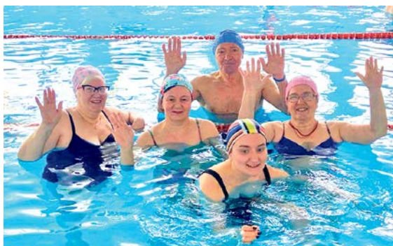
▲ На день рождения – в бассейне!

да жил в Москве на Выставке достижений народного хозяйства, где демонстрировались роботы и станки с числовым программным управлением.