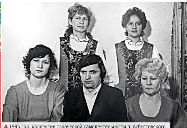
▲ 1985 год, коллектив творческой самодеятельности п. Асбестовского