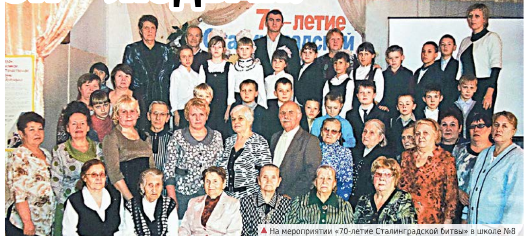
▲ На мероприятии «70-летие Сталинградской битвы» в школе №8