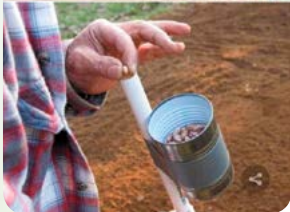
◀ Удобный способ посадки na-dache.pro