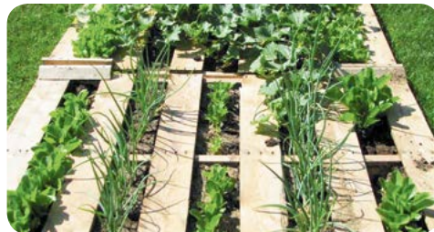
▲ Простые и удобные грядки из поддонов dzen.ru