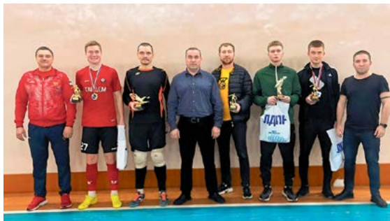
▲ Лучшие игроки