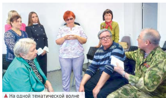
▲ На одной тематической волне

22 апреля в Алапаевск, чтобы пообщаться с молодежью и членами литературных объединений «Цветы добра» и «Вдохновение», приехал редактор и составитель