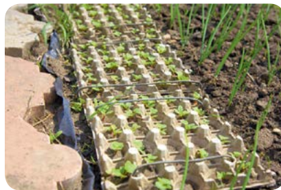
▲ В каждой ячейке должны быть проделаны дренажные отверстия