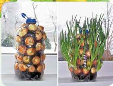
▲ Выращивание лука на окне