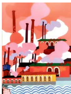
▲ Капсульная коллекция сувениров «Бунташный город»

– Очень радует, что Алапаевск попал в поле зрения специалистов «Лаборатории уральского сувенира», которые создают уникальные коллекции сувениров для городов Среднего Урала. Благодаря заинтересованности жителей города и дизайнеров богата, многогранная история Алапаевска нашла свое отражение в современной линейке сувенирной продукции. Работа ещё не закончена, и мы с нетерпением ждем новых коллекций.