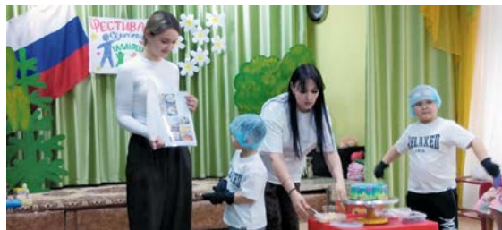
▲ Семья Дзержинских