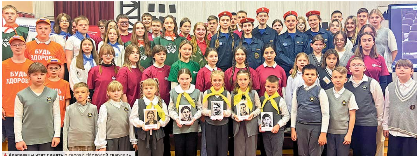
▲ Алапаевцы чтят память о героях «Молодой гвардии»

Денис КЛЕЩЕВ