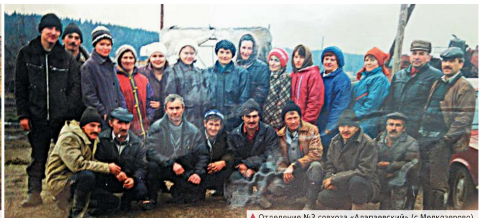
▲ Отделение №3 совхоза «Алапаевский» (с.Мелкозерово)