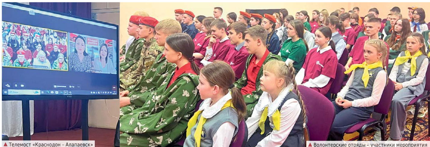
▲ Телемост «Краснодон – Алапаевск»