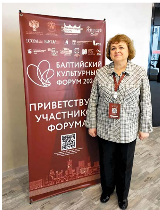
▲ Снимок на память в Светлогорске