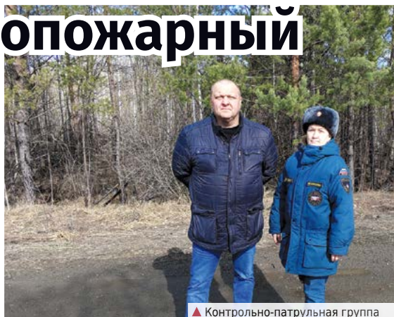
▲ Контрольно-патрульная группа

На Урал внезапно и довольно рано для нашего региона пришла очень тёплая погода. На территории Муниципального образования город Алапаевск введён особый противопожарный режим – введён он не просто так – опасность лесных пожаров высока! А чтобы люди соблюдали особый противопожарный режим, на территории муниципального образования осуществляют свою работу контрольно-патрульные группы.