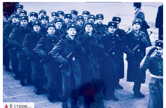
▲ В строю...

сердцах перерастет во внутреннюю силу, которую уже никто не сможет преодолеть.