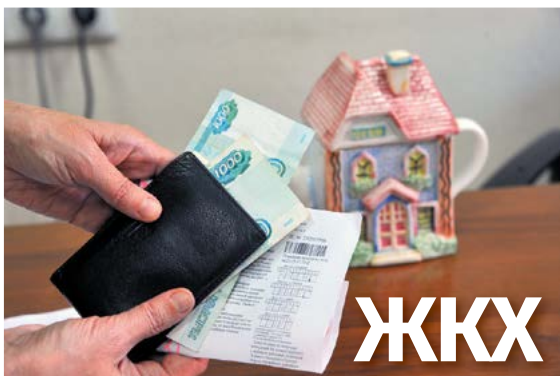
▲ Снимок Алексея Кунилова | oblgazeta.ru

В соответствии со ст. 16 Закона РФ «О защите прав потребителей» №2300-1 исполнитель не вправе без согласия потребителя выполнять дополнительные платные услуги (работы) за плату.