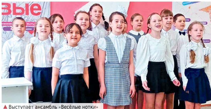
▲ Выступает ансамбль «Весёлые нотки»