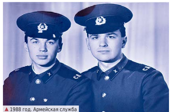
▲ 1988 год. Армейская служба