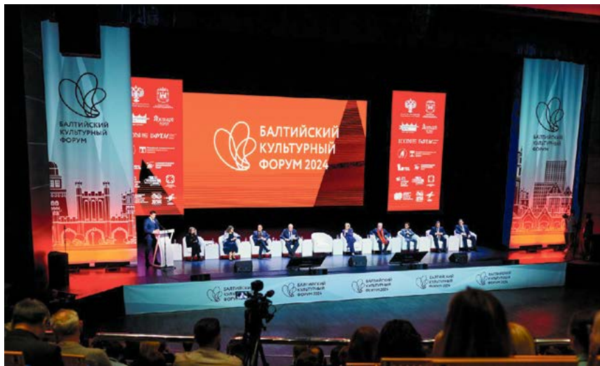
▲ Первый день пленарного заседания