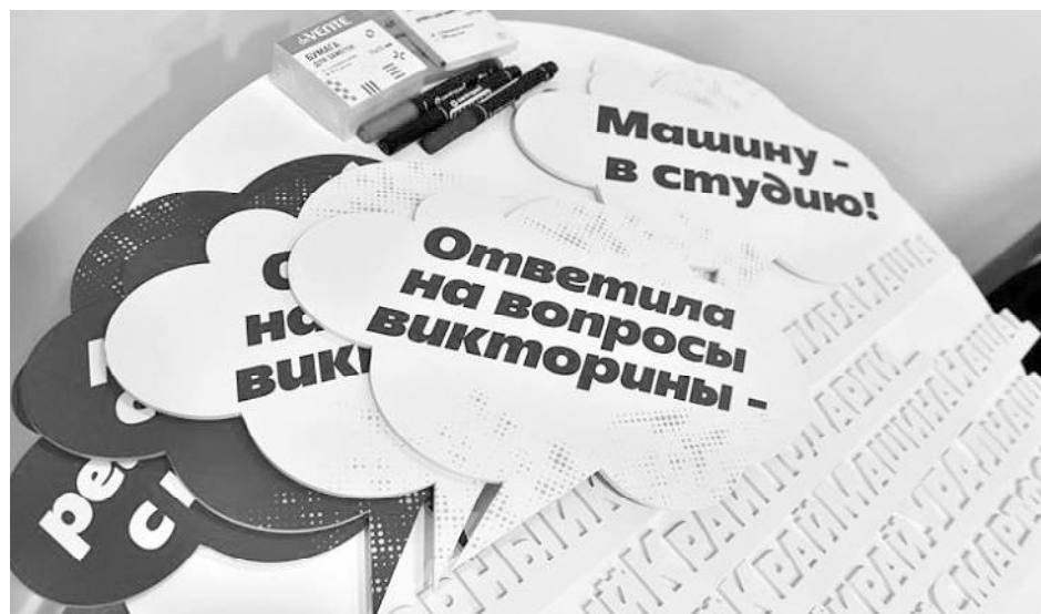
В пунктах выдачи для обладателей ценных подарков создается праздничное настроение: работает фото-зона, где обладатели подарков могут сфотографироваться с хэштегами

Не менее эмоциональным оказалось и утро следующего дня. В 10.00 открылись пункты выдачи ценных подарков в ТЦ «Мега» в Екатеринбурге и в ДК им. Владислава Костевича в Ирбите. В Екатеринбурге оформляют документы на квартиры, автомобили и смартфоны, а в Ирбите – на мотоциклы «Урал». Многие приехали в «Мега» с самого утра.