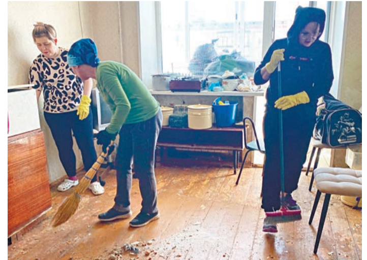
За день удалось привести в порядок лишь одну комнату и кухню