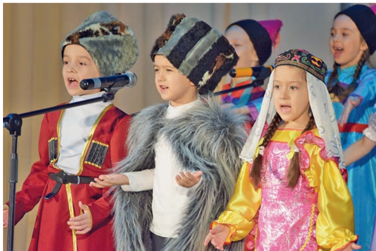
Воспитанники д/с «Дружба» с песней «Ты и я – мы одна семья»