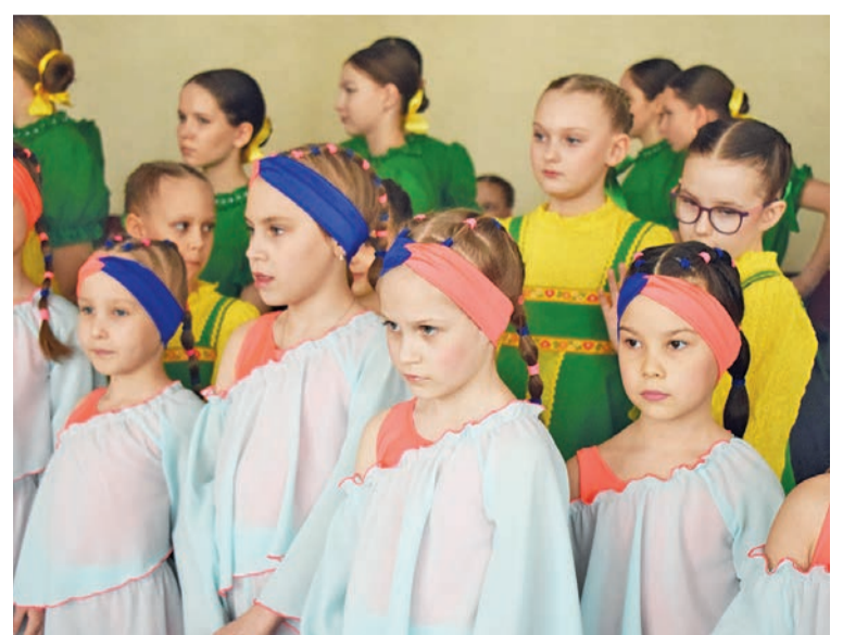
Воспитанницы хореографической студии «Эврика» перед выступлением