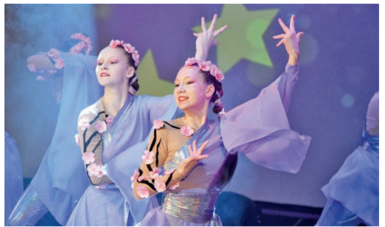
Хореографическая студия «Фиеста» с танцем «Новая Сакура» завоевала первое место