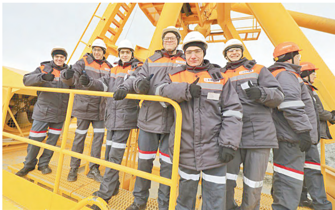
Студенты Качканарского горнопромышленного колледжа впервые поучаствовали в запуске карьерной техники

Машинист экскаватора и водитель самосвала работают в специальных антивибрационных креслах. В кабинах есть система отопления, кондиционирования и очищения воздуха от пыли и газов, а также подогрев стекол, улучшенный