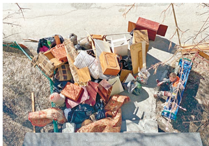
Мусор на грузовике пришлось вывозить дважды