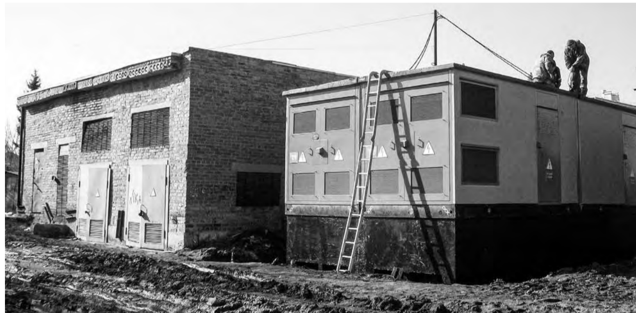
Старая и новая трансформаторные подстанции

На минувшей неделе в Ирбите начался завершающий этап работ на новом распределительном пункте 10 киловольт по улице 50 лет Октября.