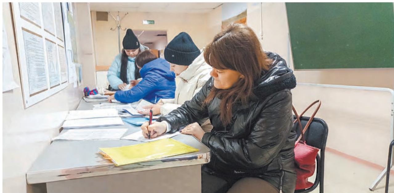
Родители подают заявления и документы на путевки в лагерь

Ирбитчане подали полторы тысячи заявлений на путевки в детский лагерь