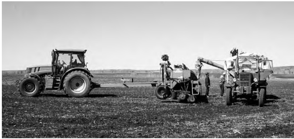
В прошлом году поля «ожили» в середине апреля

– Ирбитским учебно-техническим центром агропромышленного комплекса