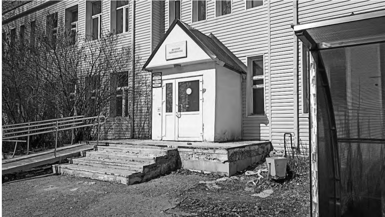
Здание детской поликлиники давно нуждалось в капремонте

В ремонт медучреждения вложат более 20 млн рублей