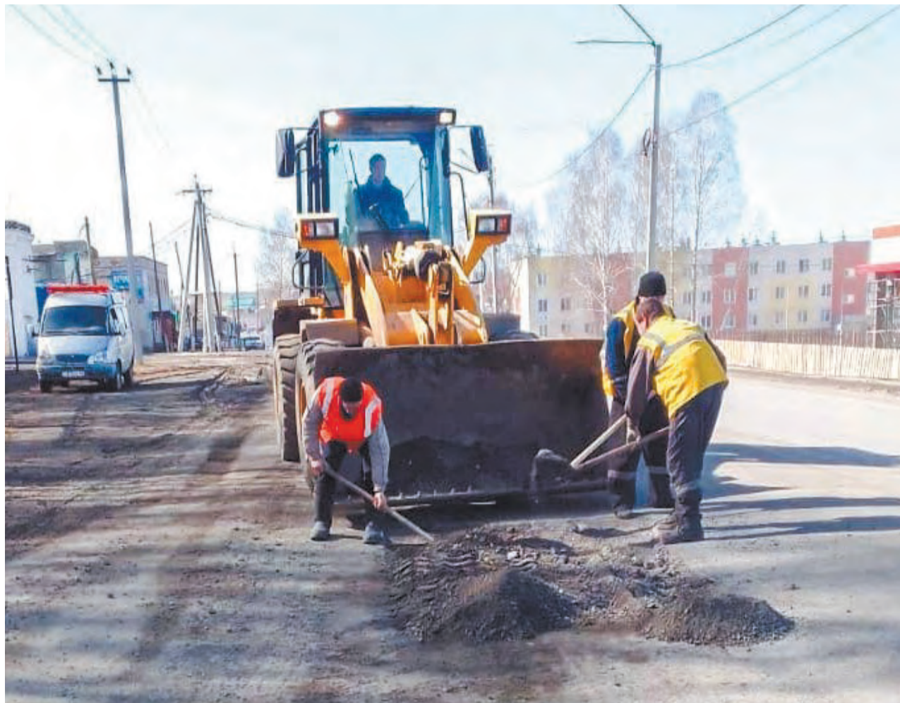
Дороги ремонтируют, в первую очередь, по маршрутам общественного транспорта

Генеральная уборка улиц идет вкупе с ремонтными работами