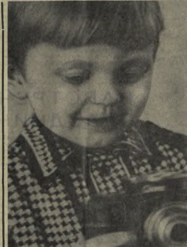
Юный фотограф.

за у многих пенсионеров возникли вопросы. Попытаюсь ответить на часто встречающиеся в моей практике. Указ не распространяется на инвалидов по старости и инвалидов детства. На пятнадцать рублей повышается пенсия тем товарищам, которые перешли на пенсию по старости, будучи инвалидами. Новым важным социальным мероприятием, предусмот-