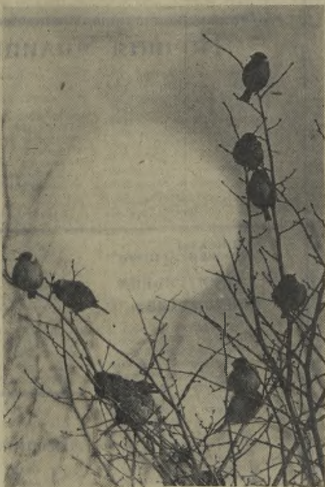
Фотоэтиюд. Утро в лесу.