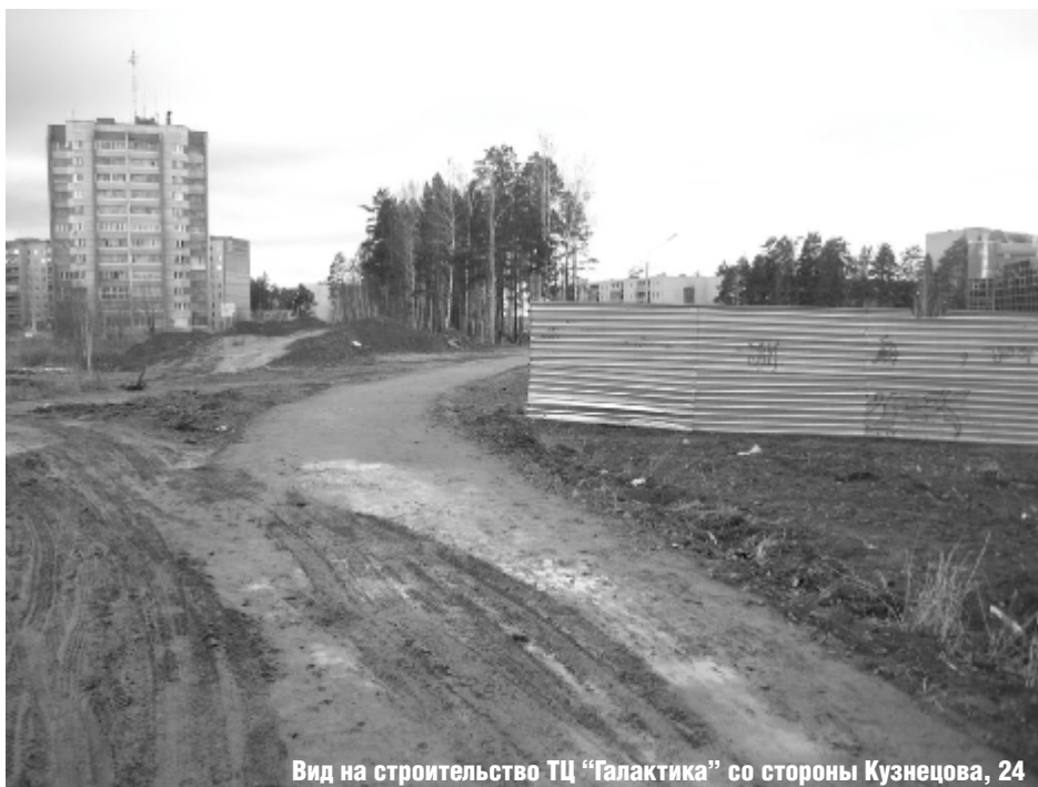
Вид на строительство ТЦ «Галактика» со стороны Кузнецова, 24