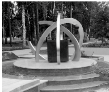
Зареченский памятник чернобыльцам с разорванной орбиталью

- Брендирование связано со слоганом: «Заречный - атомное сердце Урала». Этот слоган ярко и четко отражает имидж нашего города. Понимание здесь есть. А вот к графическому изображению есть вопросы. Данный бренд напоминает традиционную планетарную модель атома. Это модель атома Бора-Резерфорда, созданная в 1911 году. В центре - ядро атома, вокруг него по замкнутым орбитальным движатся электроны. Каждый физик понимает, что эта модель предполагает непрерывный процесс: электроны постоянно облетают, и орбиты электронов замкнуты. В логотипе представленного бренда Заречного орбиты разомкнуты и это совсем другая