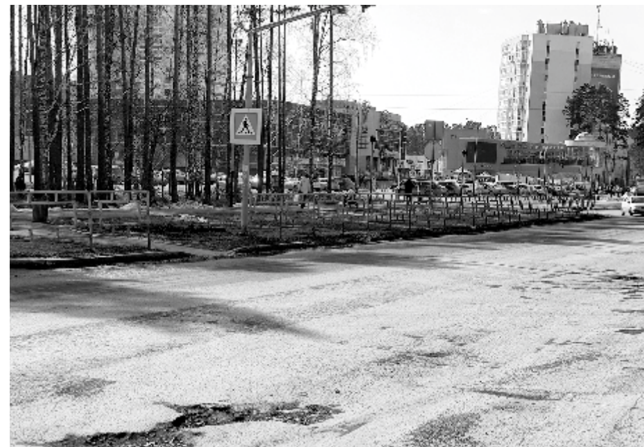
Улицу Ленинградскую отремонтируют

В ГИБДД отметили, что поначалу город не очень справлялся с очисткой дорог от снега. Этой теме даже было посвящено отдельное совещание, по итогам которого глава выдал распоряжение привести улично-дорожную сеть в нормативное состояние. И на помощь