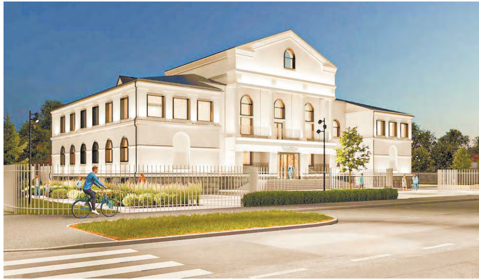
В здании на Ленина, 6, где откроется кванториум, раньше был институт

Подробности масштабного проекта для детей и подростков раскрыли в областном Дворце молодежи