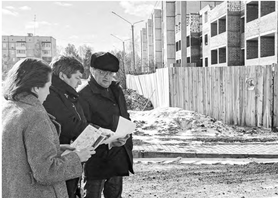
На стройплощадке многоквартирного дома