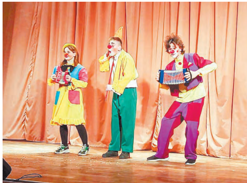
«Ирбитские чудики» во время выступления

В рамках благотворительной акции «Десант добра» воспитанники школы-студии мим-клоунады «Ирбитские чудики» побывали с концертом «Улыбка лечит» в областном госпитале для ветеранов войн, где в течение часа выступали перед бойцами и ветеранами боевых действий и коллективом госпиталя. Мини-сценки, репризы зрителями были встречены на ура, и каждая из них сопровождалась бурными аплодисментами.