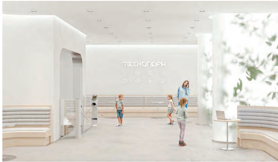
Так будет выглядеть одна из внутренних зон кванториума

Региональный оператор нацпроекта «Образование» в Свердловской области – Дворец молодежи – провел электронный аукцион по выбору подрядчика, который капитально отремонтирует помещения здания по улице Ленина, 6 в Ирбите. В этом здании откроют детский технопарк «Кванториум» – первый в городе. На ремонтные работы планируется выделить более 130 млн рублей. «Восход» связался с Дворцом молодежи и выяснил детали масштабного проекта.