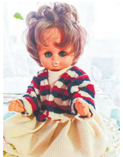
Кукла производства ГДР «возрастом» 55 лет