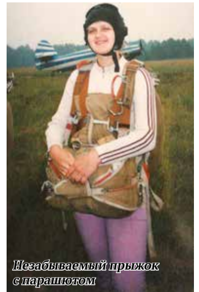
Незабываемый прыжок с парашютом

- Удалось. Начинали, правда, с нуля. Сначала искали здание под нашу мастерскую, покупали оборудование - одну швейную машинку, другую, набирали штат, закупили ткань, искали рынки сбыта. Так, постепенно, нам с подругой удалось запустить в Верхней Туре мастерскую по пошиву спецодежды. Шили мы для продажи и в розницу, и оптом, в