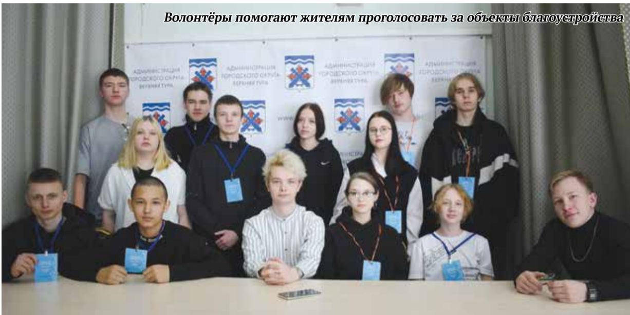
Волонтеры помогают жителям проголосовать за объекты благоустройства

Продолжается голосование за определение территорий, подлежащих благоустройству в 2025 году, в рамках реализации федерального проекта «Формирование комфортной городской среды» (ФКГС) национального проекта «Жилье и городская среда».