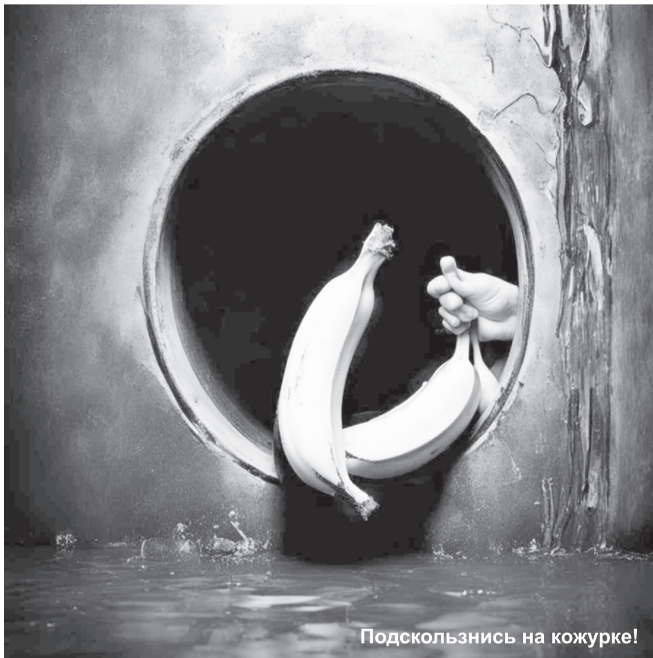
Подскользнься на кожурке!