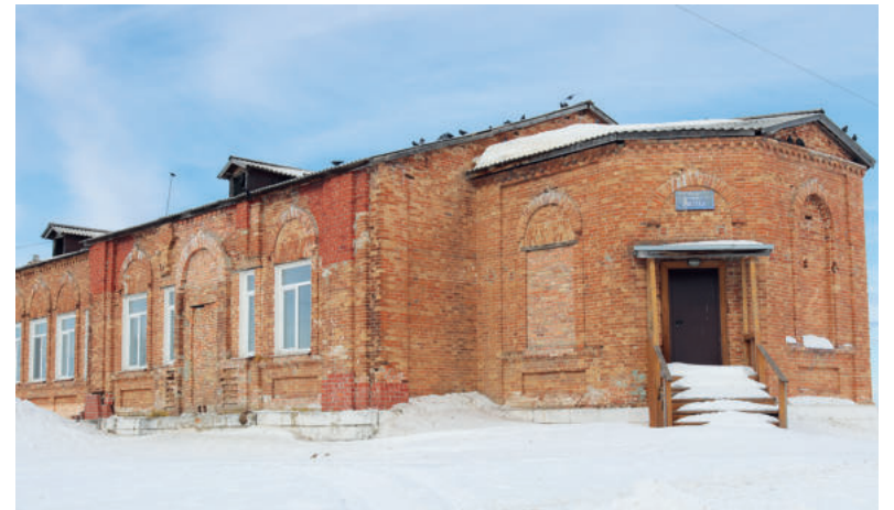
Здание Большекочевской школы изначально строилось как церковь. Строили ее всем миром, но не успела церковь открыть свои двери. После революции здание было отдано под школу.