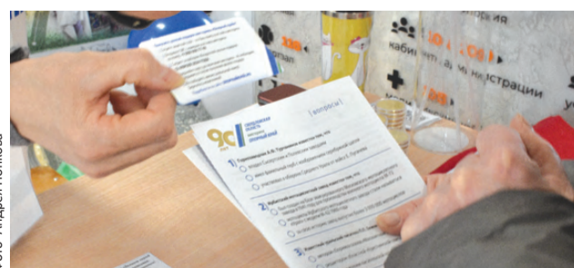
Не просто вопросы – веки истории региона

Итак, викторина завершилась, что дальше? Осталось проверить, есть ли ваш код в списке претендентов на ценные подарки на сайте акции опорныйкрай.рф. Это первое. Второе. Кто какой подарок получит, определяют 12 апреля. Церемонию проведет сам Леонид Якубович. Мероприятие будут транслировать в пря-