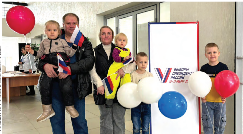
Семья Абрамовых: избиратели и юные наблюдатели

71% избирателей проголосовал на выборах Президента РФ в Свердловской области, 70% – в Первоуральске