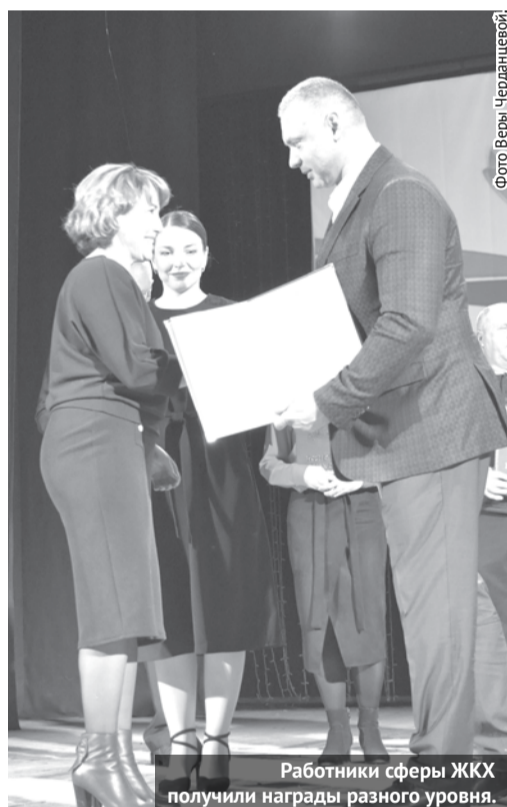
Работники сферы ЖКХ получили награды разного уровня.

территориях МКД. Поэтому будет не просто всем, но необходимо проявить терпение и понимание, ведь конечный результат того стоит. Всё это делается для надёжного обеспечения теплом и горячей водой жителей многоквартирных домов. Положительные результаты от реконструкции теплосетей богдановичцы смогут ощутить уже этой зимой. Кроме того, ресурсоснабжающие организации по своим планам будут также проводить ремонтные работы, в том числе по замене трубопроводов. Поэтому, если в каком-либо доме будет произведено отключение воды, жильцы смогут позвонить в ЕДДС по телефонам: 8 (34376) 5-09-02 или 112 , чтобы узнать, с какими работами оно связано. Диспетчеры службы будут владеть всей информацией по отключениям.