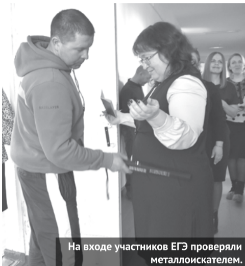
На входе участников ЕГЭ проверяли металлоискателем.

На минувшей неделе в пункте проведения экзамена (ППЭ) на базе школы №3 прошла всероссийская акция «Сдаём вместе! День сдачи ЕГЭ родителями». Родители выпускников, сдающих в этом году единый государственный экзамен, смогли проверить свои знания по истории