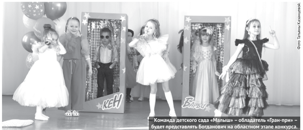
Команда детского сада «Малыш» - обладатель «Гран-при» - будет представлять Богданович на областном этапе конкурса.

На минувшей неделе состоялся ежегодный муниципальный конкурс показа одежды «Золотая катушка - 2024»