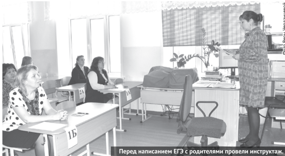
Перед написанием ЕГЭ с родителями провели инструктаж.