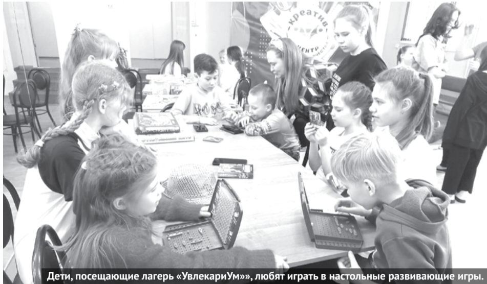
Дети, посещающие лагерь «УвлекариУм», любят играть в настольные развивающие игры.

В прошедшую субботу для 30 детей распахнулись двери весенней смены оздоровительного лагеря с дневным пребыванием детей «УвлекариУм» на базе ЦДТ «Креатив»