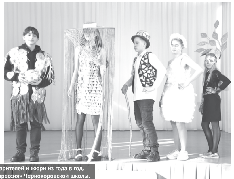
Разнообразие образов и полет фантазии участников впечатляют зрителей и жюри из года в год. На фото: коллекции «Нежность» Барабинского СДК (слева) и «Экспрессия» Чернокоровской школы.