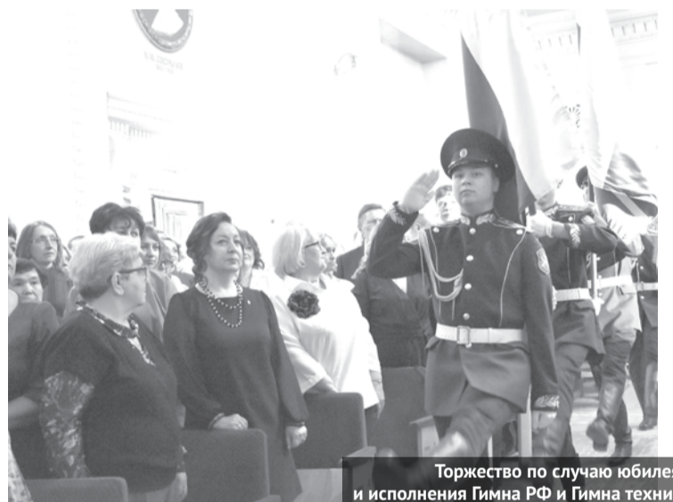
Торжество по случаю юбилея началось с выноса знамен и исполнения Гимна РФ и Гимна техникума, написанного к юбилейной дате.

Весь вечер коллектив техникума принимал поздравления, пожелания, цветы и подарки, хорошее настроение участникам праздника создавали артисты, которые дарили свои творческие номера. Яркое торжество надолго останется в памяти каждого. 80-летний юбилей техникум встретил, уверенно глядя в будущее, а значит, впереди новые успехи и перспективы в развитии и подготовке конкурентноспособных специалистов.