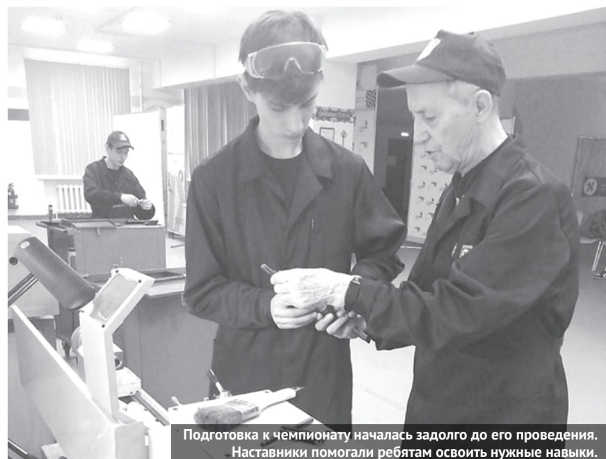
Подготовка к чемпионату началась задолго до его проведения. Наставники помогали ребятам освоить нужные навыки.

После длительных тренировок и отработок конкурсных заданий ребята достойно представили свои учебные заведения и преподавателей-наставников на соревнованиях. 29 марта пройдёт торжественное закрытие чемпионата, на тот момент будут известны его итоги. Надеемся, что наши участники и в этом году войдут в число победителей и призёров соревнований.