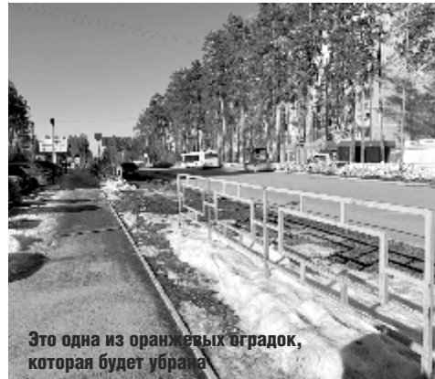
Это одна из оранжевых ограждений, которая будет убрана