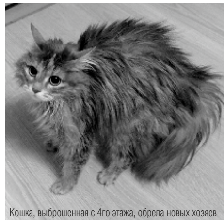
Кошка, выброшенная с 4го этажа, обрела новых хозяев

Общественница отмечает, что, несмотря на активность в социальных сетях и негодование по каждому случаю жестокого обращения с животными, жители города неохотно обращаются в полицию с заявлением. Зооволонтеры в свою очередь понимают важность привлечения к ответственности живодеров и безответственных хозяев, однако сил на эту работу хватает не всегда. Тем более, что обращения были, но результа-