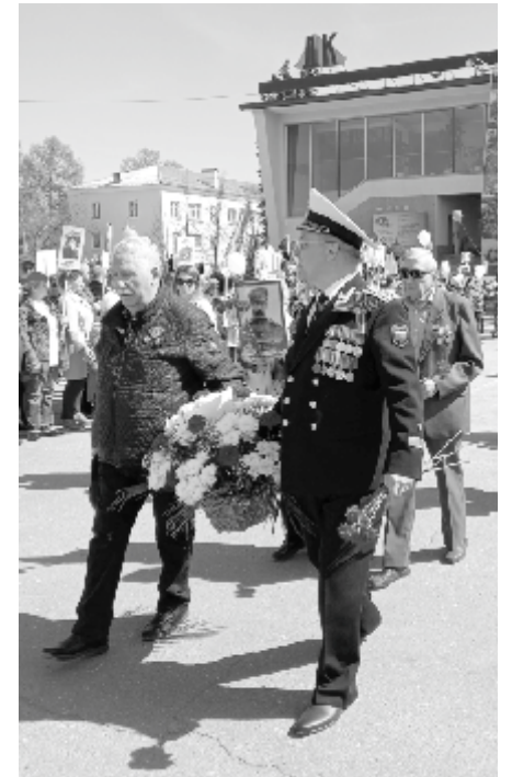
Ветеранам - на праздники