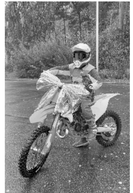
Спортсменам - на запчасти