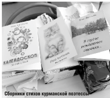
Сборники стихов курманской поэтессы