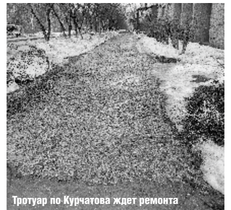
Тротуар по Курчатова ждет ремонта

Напомним, в 2022 году впервые в нашем городе заработала программа «Депутатский миллион». Каждому из народных избранников выделили из бюджета по 100 тысяч рублей на исполнение наказов избирателей. Депутаты не имели к этим деньгам прямого доступа, но могли направить их на решение проблем своих избирателей. В 2023 году средств заложили в два раза больше, то есть по 200 тысяч рублей. В конце прошлого года в результате работы согласительной комиссии в бюджете Заречного на 2024 год было предусмотрено 6 млн рублей на реализацию наказов избирателей, то есть по 300 тысяч рублей на каждого депутата.