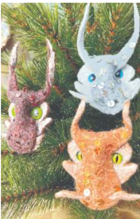
Броши «Дракоши» от Златы Вахловой