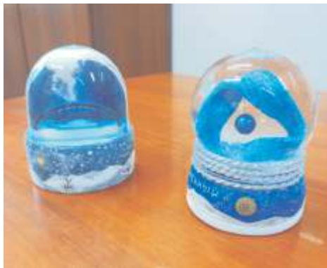
Уникальные снежные шары