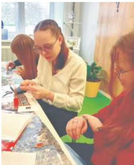
Мастер-класс по созданию украшений из акрила