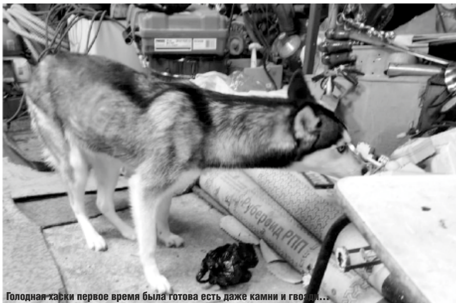
Голодная хаски первое время была готова есть даже камни и гвозди...