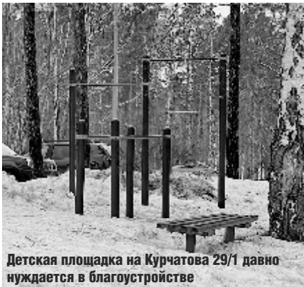
Детская площадка на Курчатова 29/1 давно нуждается в благоустройстве

При февральской корректировке бюджета Заречного на текущий год были внесены изменения, касающиеся, в том числе, и распределения части депутатских средств на исполнения наказов избирателей. К марту с проектами определились 17 народных избранников из 20. Расскажем, куда в этом году пойдут депутатские средства.