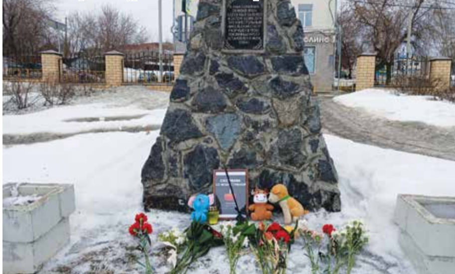
Жители Верхней Туры вместе со всей страной

сти, сплоченности, взаимной поддержки, хотя те, кто планировал теракт, рассчитывал посеять панику и разлад в обществе. Вместо этого, по словам Путина, организаторы встретили единение и решимость противостоять этому злу.