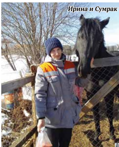
Ирина и Сумрак