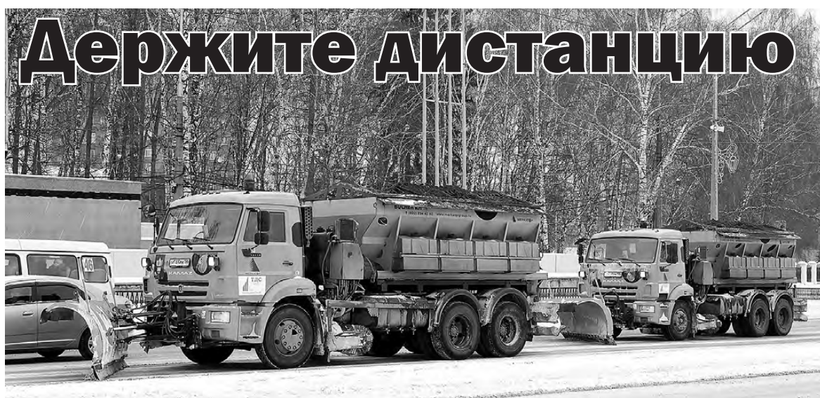
Колонна снегоуборочной техники на проспекте Ленина.

В период сильных снегопадов сотрудники Тагилдорстроя, УБТ-Сервиса и Капиталстрою работают в усиленном круглосуточном режиме, без праздников и выходных. В отличие от некоторых других городов региона, у нас по дорогам можно ездить, а по тротуарам ходить, не опасаясь увязнуть в сугробе.