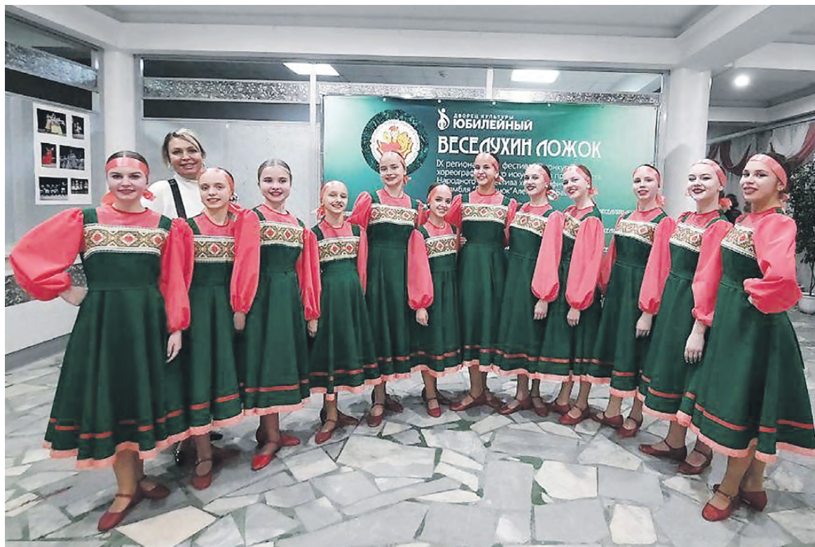
Коллектив танцевальной студии «Антарио».

Кстати, этой осенью газета «Тагильский рабочий» уже рассказывала читателям об оче-