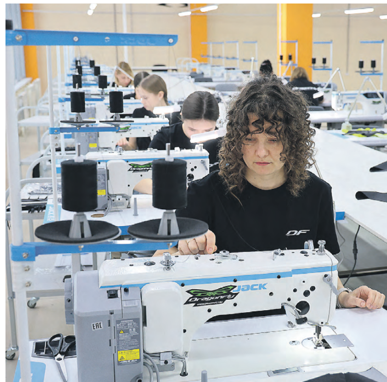
Практиканты из профессионального колледжа им. А.Н. Демидова.

В индустриальный Нижний Тагил возвращается легкая промышленность. Ее возрождению помог уход зарубежных брендов из России, и местные предприятия сегодня производят одежду, детский трикотаж, интерьерный текстиль для продажи в магазинах и на онлайн-площадках. Нынче тагильский легпром пополнил цех известной в Екатеринбурге компании Dragonfly. Здесь налажен пошив экипировки для спортсменов и любителей активного отдыха.