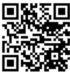
Официальный паблик Нижнего Тагила

Наведите камеру смартфона и пройдите по ссылке