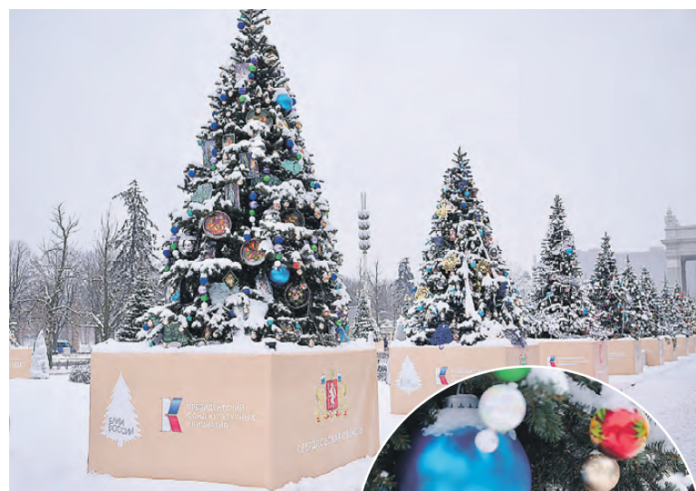
89 елок по количеству регионов страны, уральская украшена тагильскими подносами и расписными шарами.

Кстати, работы мастеров Нижнего Тагила никого не оставили равнодушными. Самым ярким украшением выставки стала ель Свердловской области, украшенная расписными шарами и подносами тагильских мастериц.