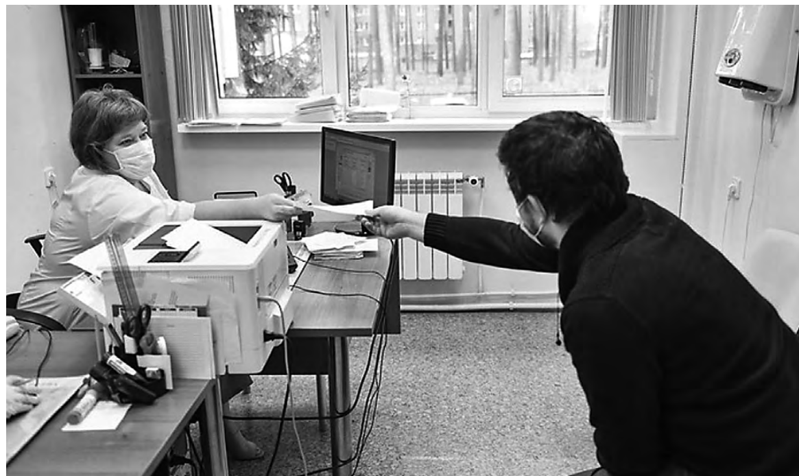
В Центре СПИДа пациентов, живущих с ВИЧ, принимают врачи-инфекционисты.

– Главное, не оставаться одному в это время. Как можно быстрее собраться с силами и обратиться к специалистам службы СПИДа – врачу-инфекционисту,