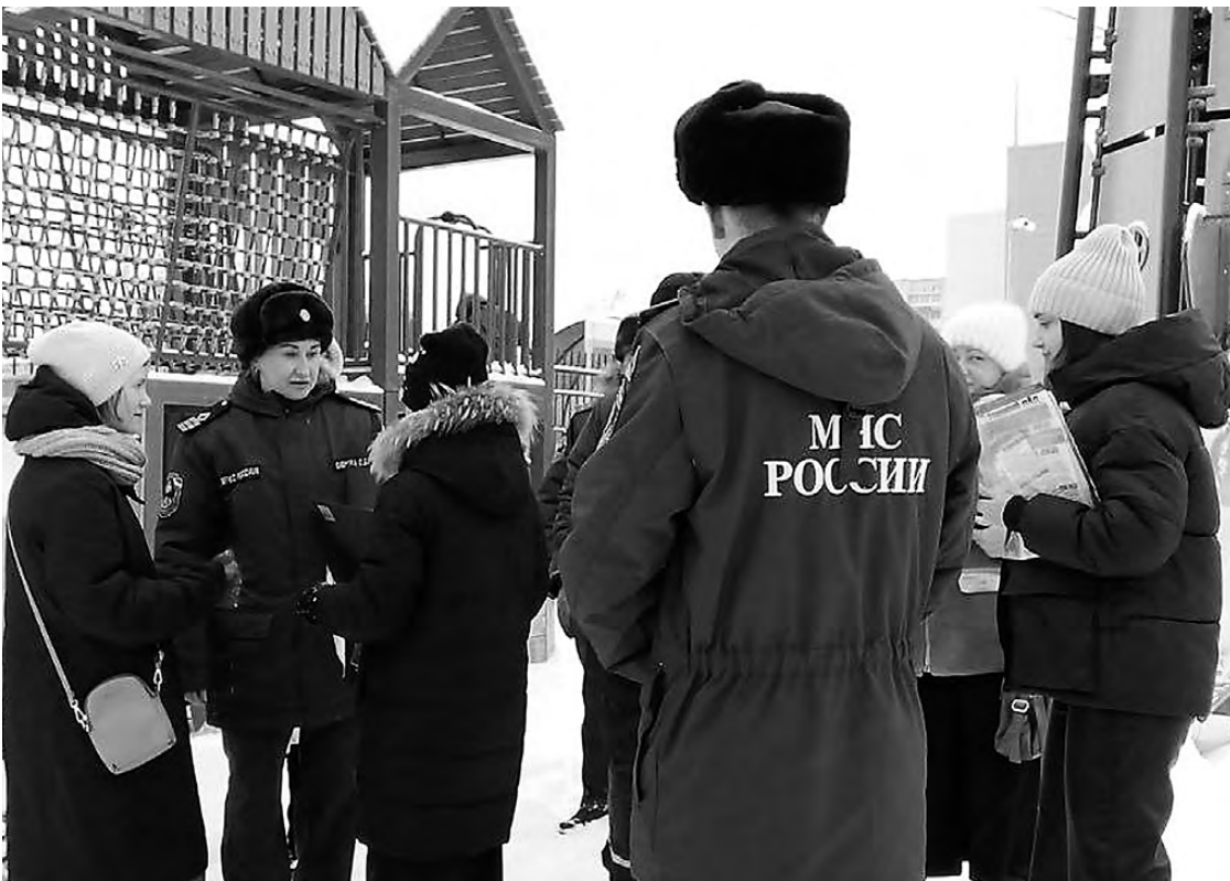
Ежедневно на берега водоемов выходят спасатели, инспекторы и полицейские.

В прошлом номере мы показали первых любителей зимней рыбалки. С 1 ноября в области проводится профилактическая акция «Тонкий лед». Ежедневно сотрудники МЧС, ГИМС, МВД, Центра защиты населения и районных администраций выходят в рейды. К одному из них присоединился журналист «ТР».