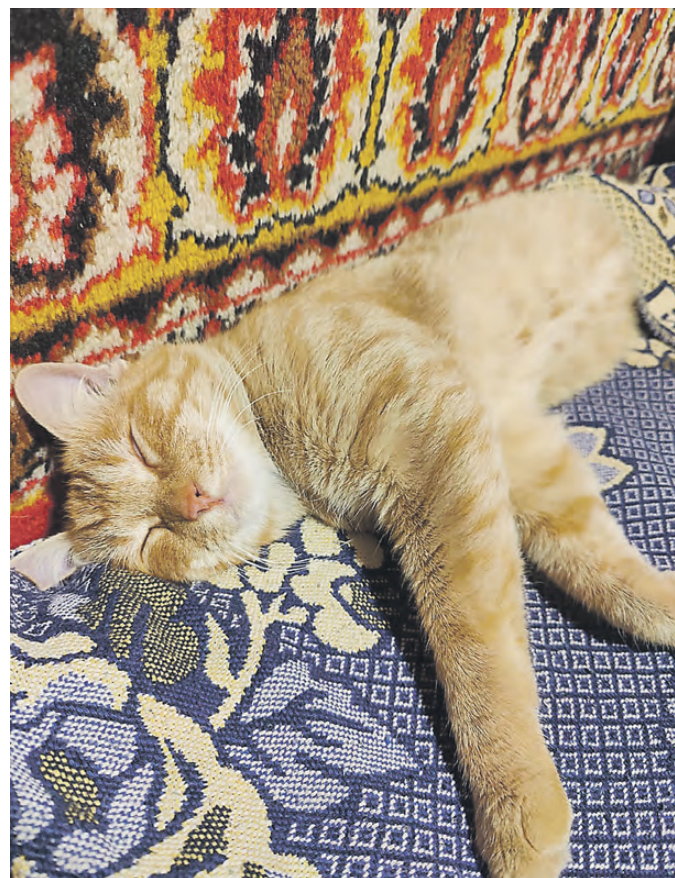
Рыжик с остановки.