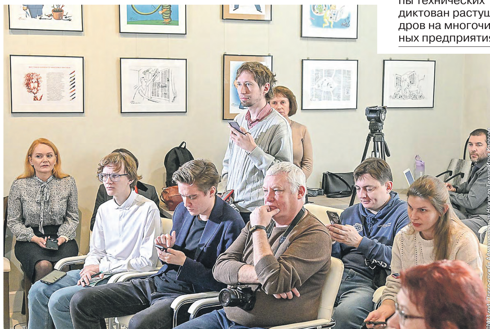
Журналисты региональных СМИ задали тагильскому мэру вопросы из разных сфер.

«Глава города также уверен, что муниципалитету нужно свое учреждение высшего образования или даже группы технических вузов. Этот шаг продиктован растущим дефицитом кадров на многочисленных промышленных предприятиях.