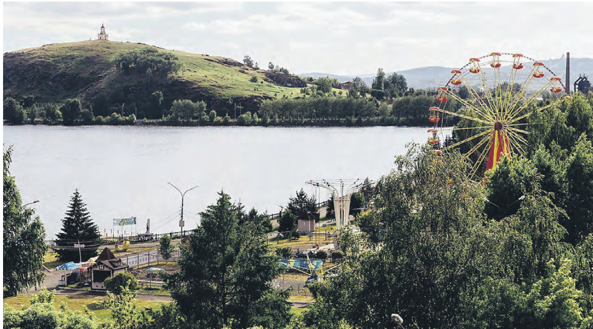
Лисья гора – универсальный магнит для туристов.

Какие точки притяжения, кроме Лисьей горы, наш город может предложить своим гостям? Как привлечь зрителей на состязания летающих лыжников? Почему некоторые здания с богатой историей находятся в плачевном состоянии? На эти и другие вопросы, влияющие на развитие туризма в нашем городе, искали ответы участники встречи в Торгово-промышленной палате Нижнего Тагила (ТПП НТ).