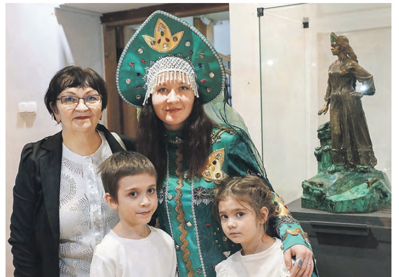
Фото на память с Хозяйкой Медной горы.

«Ночь искусств» подарила жителям и гостям Нижнего Тагила море положительных эмоций и новых впечатлений. Культурное многообразие города предстало во всей красе благодаря энтузиазму организаторов и активности посетителей.