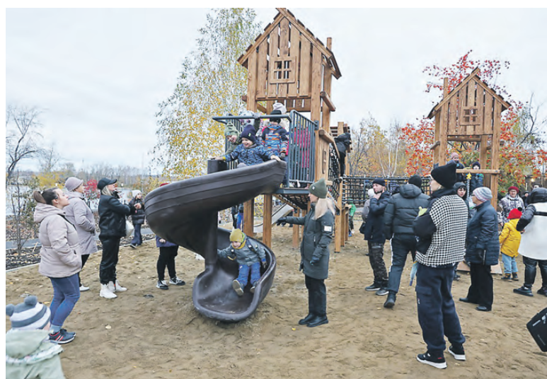
Обновленный Нижневыйский сквер открыли этой осенью.