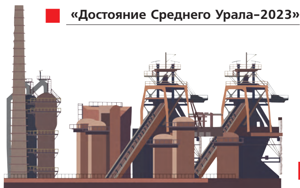
■ «Достояние Среднего Урала-2023»