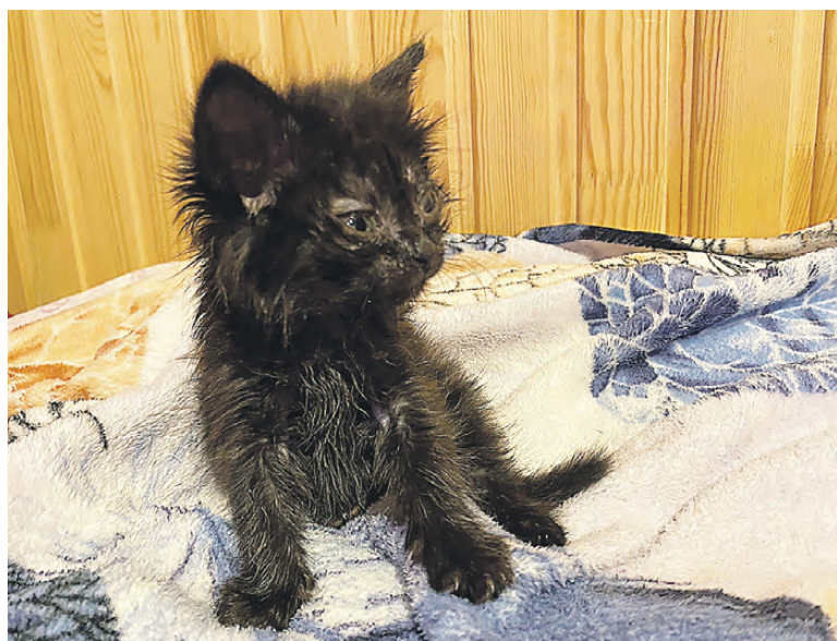
Бася: такой она была

- Моя сестра отняла маленького щенка у мальчишек, кото-