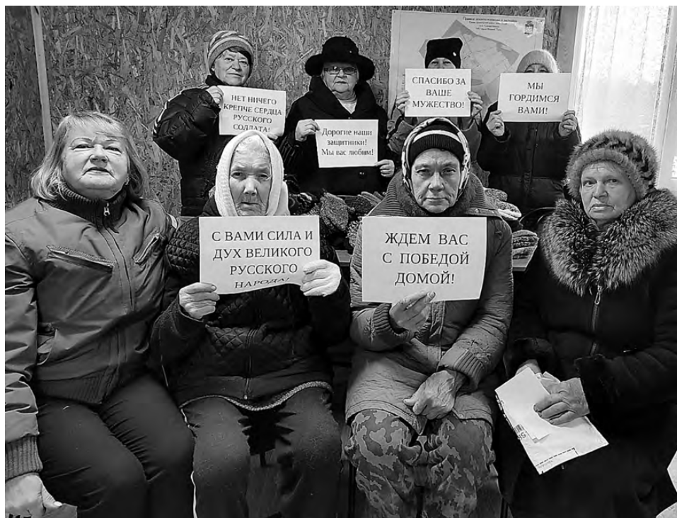
Селянки из Елизаветинского могут и носки связать, и инструмент собрать.