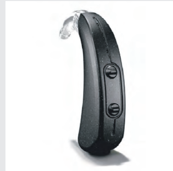
Цифровой аппарат (Германия)