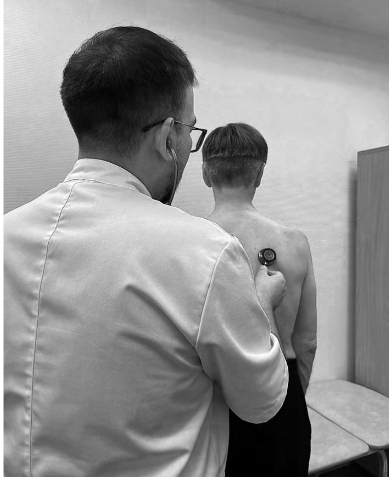
Для пневмонии характерны одышка и невозможность дышать полной грудью.

Кроме инфекции на развитие пневмонии могут влиять такие