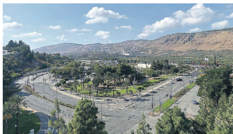
Небо только кажется мирным.

Магазины работают штатно, дефицита продуктов нет. Цены поднялись, но Евгения считает, что это не связано с началом военных действий. Вспоминает