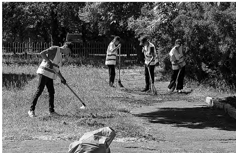
Теперь достаточно письменного согласия одного из родителей на трудоустройство ребенка.

Российская Газета RGRU - информационный партнер «ТР»