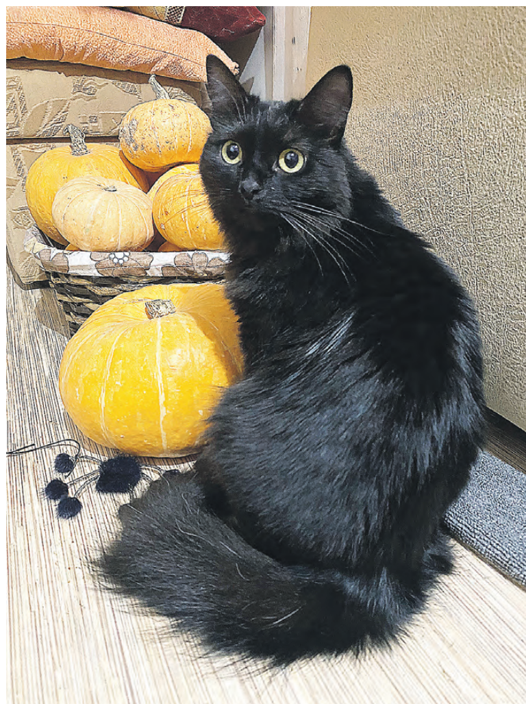
...и такой стала.

шли три котенка. Супруги стали приучать животных к корму. Сначала усатые подходили к еде издали, потом все ближе и ближе. Постепенно кошки осмелились зайти на крыльцо.