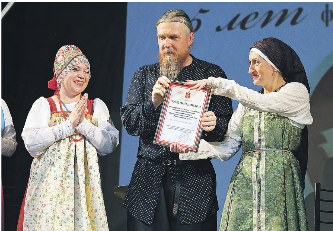
Артисты «Соловейки» с очередной наградой.

В репертуаре около 300 песен и наигрышей горнозаводского населения Среднего Урала и жителей Пермского края. Особенность коллектива в том, что его участники не перпевают известные всем народные песни, адаптированные для современного слушателя, а берут за основу музыкальный материал, полученный во время этнографических экспедиций, записанный у старожилов, ос-