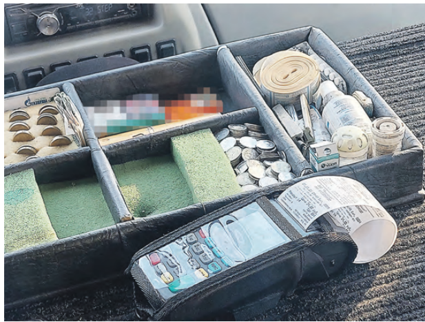
Пока безналичная оплата действует только на двух маршрутах.

Пока в планах такого нет, сообщают в транспортной компании. Сейчас обслуживание работает в тестовом режиме, в новом году безналичный расчет будет запущен на всех маршрутах согласно муниципальному контракту. В службе заказчика добавляют, что подтверждением внесения платы является напечатанный устройством билет, который