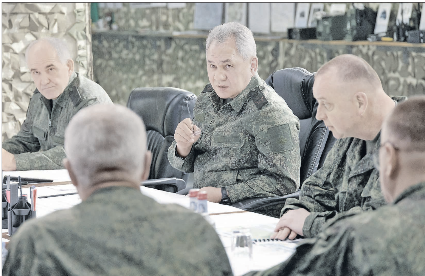
Министр обороны Российской Федерации генерал армии Сергей Шойгу в ходе рабочей поездки в зону специальной военной операции проверил передовой пункт управления российской группировки войск «Восток» на южнодокечном направлении.

МИНИСТР ОБОРОНЫ РФ ГЕНЕРАЛ АРМИИ СЕРГЕЙ ШОЙГУ В ЗОНЕ СВО ПРОВЕРИЛ ПЕРЕДОВОЙ ПУНКТ УПРАВЛЕНИЯ ГРУППИРОВКИ ВОЙСК «ВОСТОК»