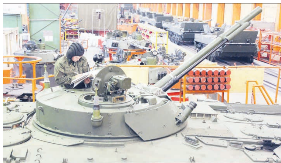
Курганмашзавод отгрузил Минобороны России финальную партию БМП-3 и десантных бронетранспортёров БТР-МДМ по госконтрактам текущего года.