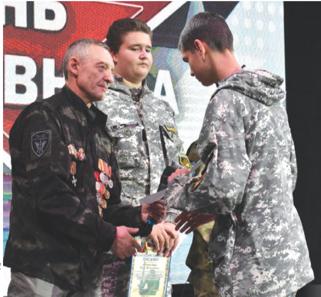
На мероприятии отметили работу местных поисковиков

В Первоуральске состоялось традиционное мероприятие, посвященное Всероссийскому дню призывника. По случаю знаковой даты в Инновационном культурном центре собрались порядка 250 ребят: воспитанники военно-патриотических клубов и организаций, а также сами виновники торжества – призывники.