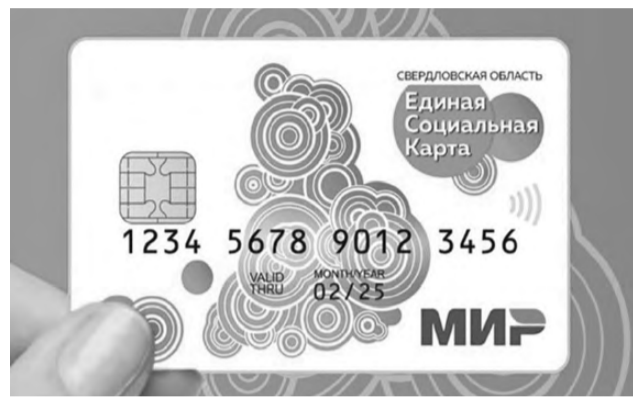
Чтобы воспользоваться льготой на проезд, получите «Уралочку»

- инвалиды и участники Великой Отечественной войны; - бывшие несовершеннолетние узники концлагерей, гетто, других мест принудительного содержания;