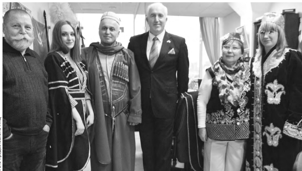
На встрече с представителями диаспор: добро получено!