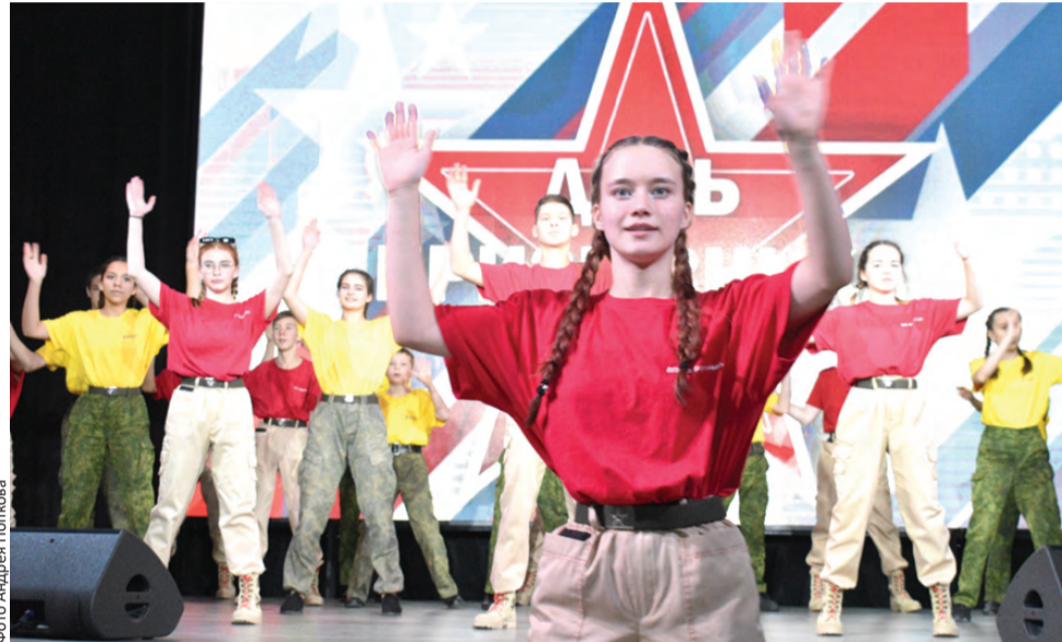
Каждый «взвод» выступил с творческим номером