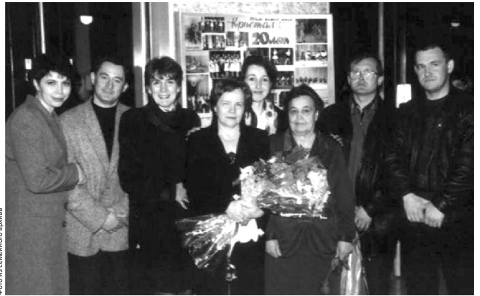
На вечере встречи с выпускниками