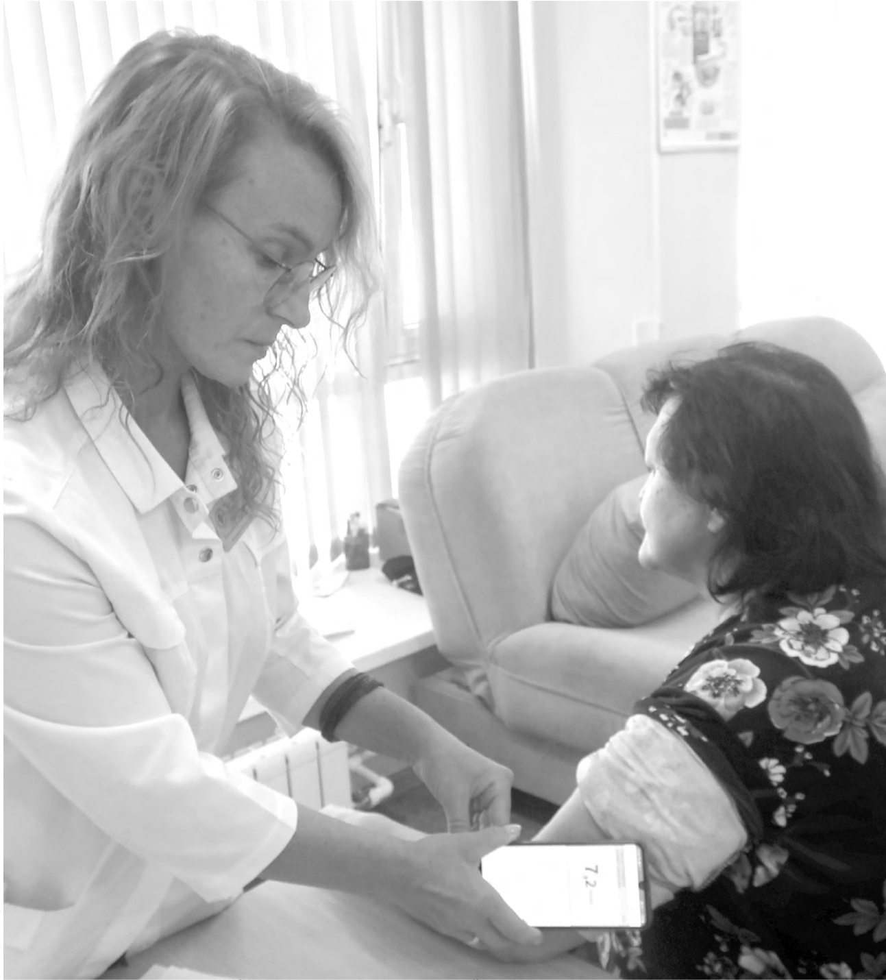
Диагностировать диабет можно на основании исследований сахара крови натощак и уровня гликозилированного гемоглобина

— К диабету II типа может привести наследственная предрасположенность. Могут повлиять такие факторы, как избыточное питание, малоподвижный образ жизни. Те, у кого есть лишний вес и ожи-