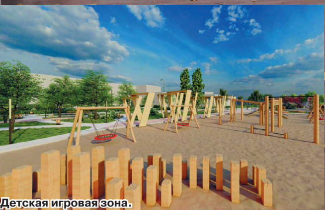
Детская игровая зона.

А вот уже на втором этапе начнется озеленение парка и установка конструкций. Маленьких режевлян, безусловно, порадует детская площадка, а взрослым будет где сделать эффектное фото. С нетерпением ждем того момента, когда парк «Талицкий» будет готов и открыт для посещения! Уверены, он обязательно будет пользоваться популярностью у режевлян.