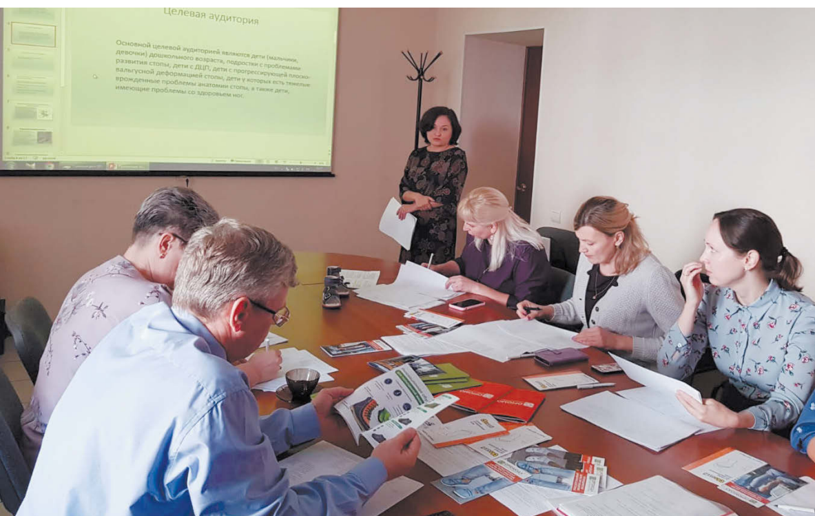
Работа комиссии по отбору лучшего социального предприятия.