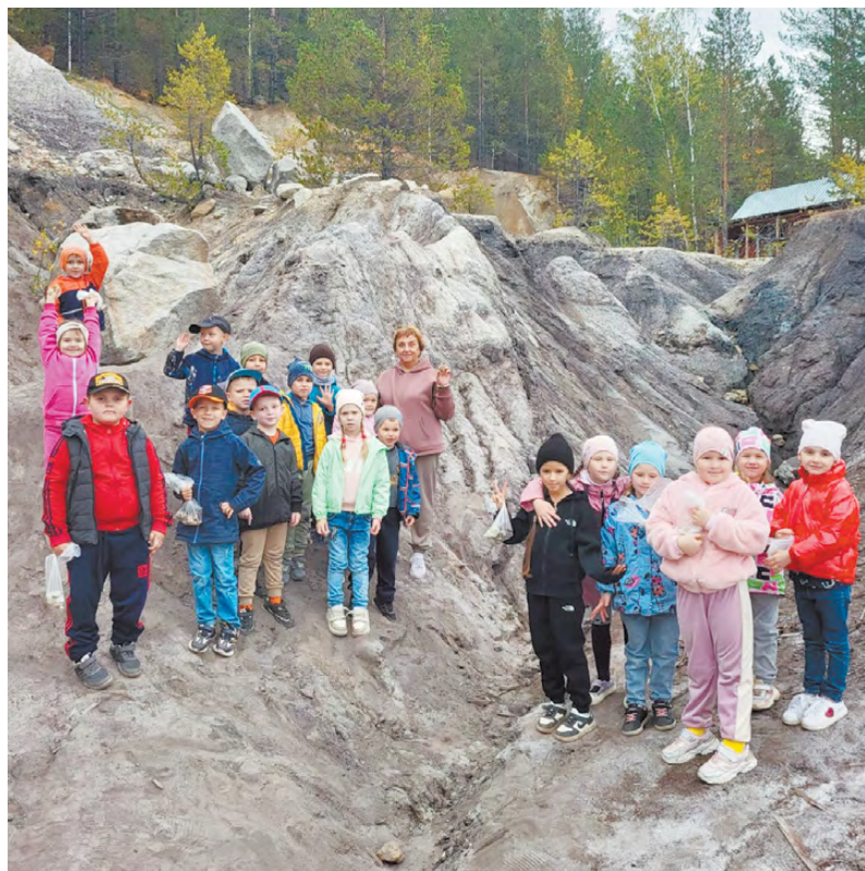
Вместе с воспитателем дети знакомятся с родным краем.