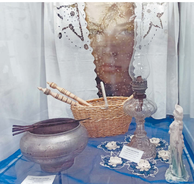
На переднем плане: керосиновая лампа стеклянная с колбой (справа), светец (на чугушке, слева). Конец XIX – первая половина XX в. Режевской исторический музей.

Хозяйка поднималась с третьими петухами. С молитвой, зажегши лучину, сперва глядела квашню. Душок от деревяшки вкрадывался в детский сон, взрослых же ставил на ноги. Обходенье с горящей щепой у хозяйки было мастерским: прихватив огня, женщина брела впотьмах по двору с ведрами пошла в хлев. В теплом хлеву хозяйка кормила живность; в стене же торчал заскорузлый кованый прут для горящего светляка. Прут-светец. Таковые можно увидеть в Режевском историческом музее.