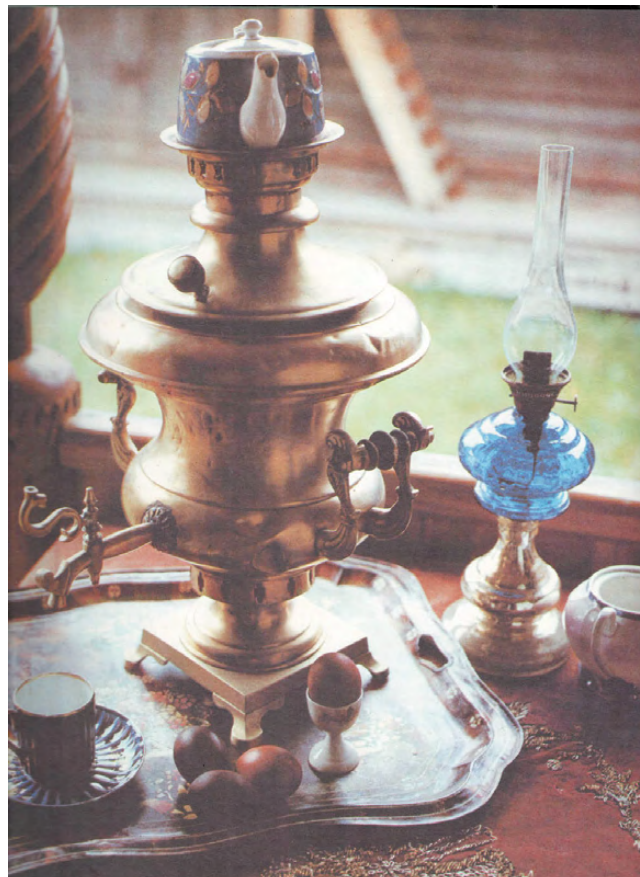
Керосиновые лампы были разные. 5-линейная – слабовата; поярче, посильней – 7-линейная. Была и 10-линейная

В полукруглую емкость с фитилем вливали керосин. Зажигали верх фитиля в горелке. Пламенный язык горел ровно, стойко и не дрожал в стеклянном колпаке. С колбы стирали копоть, налет: чищенный глянec стекла разводил мрак, словно в благодарность хозяйке. Ось с колесом могла приподнять фитильную кромку, так что огонь светил ярче.