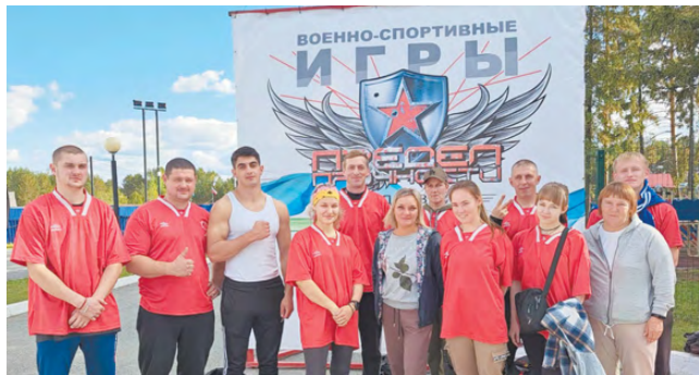
Команда спортсменов Режевского городского округа.

В начале сентября в Верхней Синячихе состоялись военно-спортивные игры сельских спортсменов Урала «Предел прочности». Это самые масштабные соревнования Восточного управленческого округа такого типа.