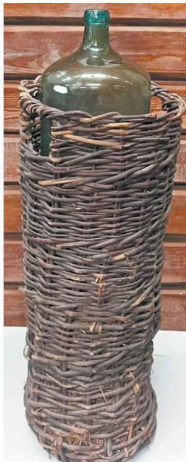
Керосиновая бутылка в плетеной корзине. Начало XX века. Режевской исторический музей.