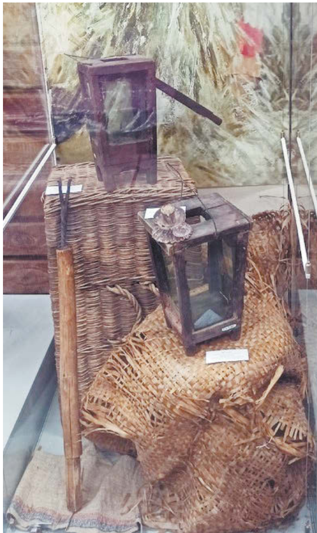
Фонари из дерева и стекла, светец (на переднем плане слева). Конец XIX – начало XX в. Режевской исторический музей.

Догорай, моя лучина, догорю с тобой и я! Не житье мне здесь без милой: С кем теперь идти к венцу?